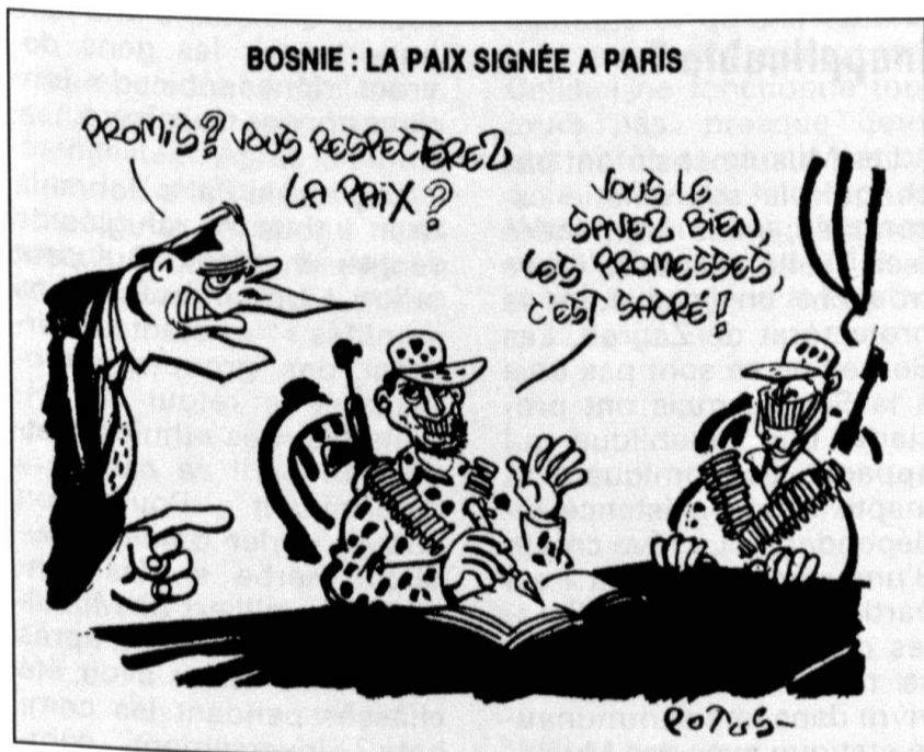
Désinformation-Hebdo, 24 décembre 1995.

Si les hostilités commencent au vu et au su de la communauté internationale, avec le soutien de certains d'Etats étrangers, la responsabilité de ceux qui ont entraîné les popula-