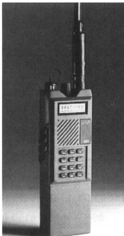
La communication aux plus bas échelons tactiques est possible dans la région.

(SE-227/SE-412), tous les postes du réseau transmettaient de la même manière sur une même fréquence, il est maintenant possible, grâce à l'identité de chaque connexion au réseau, de sélectionner un interlocuteur ou un groupe de correspondants bien déterminé. Il est de plus possible de fixer et d'utiliser des niveaux de priorités. Ainsi une station peut interrompre la communication de priorité moins élevée, que mène un interlocuteur recherché avec une tierce personne, pour forcer une transmission d'information urgente. Il est encore possible d'utiliser jusqu'à dix signaux d'alarme différents pour alerter les postes connectés au réseau.