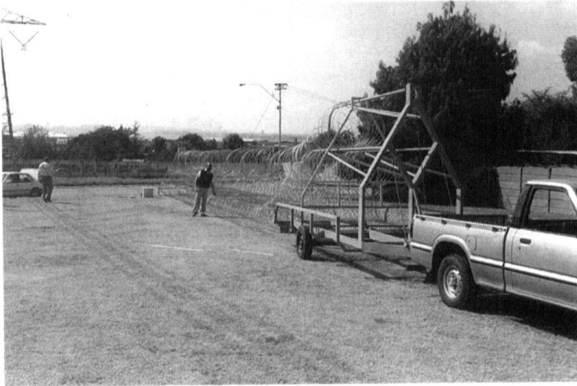
Les formations de fusiliers territoriaux ou de grenadiers territoriaux ont besoin d'un matériel spécial qui, parfois, s'apparente à celui de la police. Dans certaines situations, et la police et les fusiliers territoriaux seraient heureux de disposer de ce système de déploiement rapide pour les ribards présenté à Eurosatory 94.

Certes, la troupe engagée dans la surveillance de la frontière ou dans la protection d'ouvrages d'importance majeure pour la défense générale recevrait sa mission d'autorités civiles cantonales qui connaissent le milieu. En revanche, il ne faudrait pas oublier que les soldats requis pour telle ou telle mission de contrainte pourraient provenir de ce même milieu !