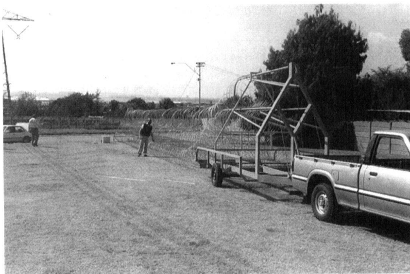
Les formations de fusiliers territoriaux ou de grenadiers territoriaux ont besoin d'un matériel spécial qui, parfois, s'apparente à celui de la police. Dans certaines situations, et la police et les fusiliers territoriaux seraient heureux de disposer de ce système de déploiement rapide pour les ribards présenté à Eurosatory 94.

Certes, la troupe engagée dans la surveillance de la frontière ou dans la protection d'ouvrages d'importance majeure pour la défense générale recevrait sa mission d'autorités civiles cantonales qui connaissent le milieu. En revanche, il ne faudrait pas oublier que les soldats requis pour telle ou telle mission de contrainte pourraient provenir de ce même milieu !