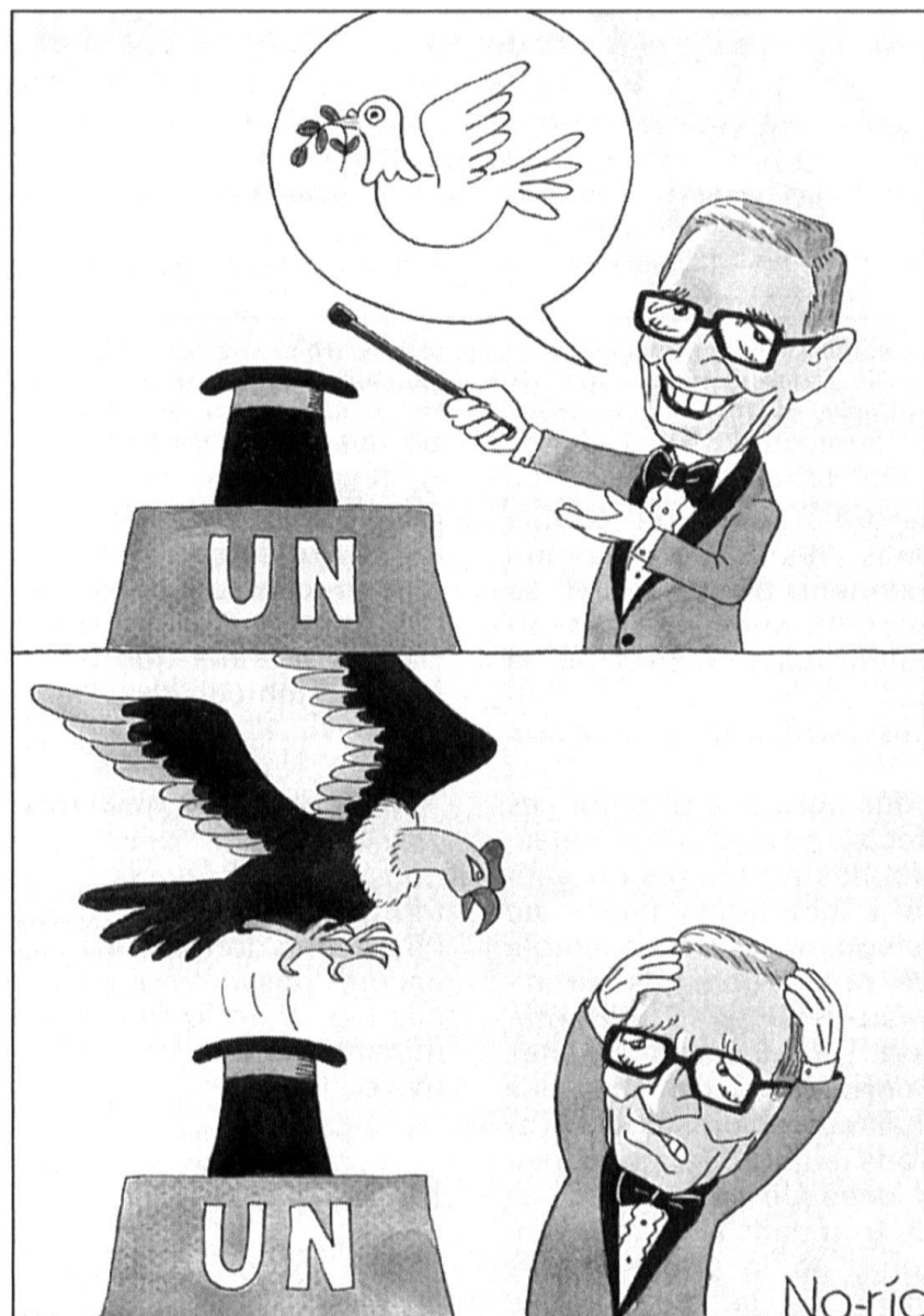
L'ONU, la « grande illusion ». Caricature tirée de Look Japan, mars 1995.

L'énergie nucléaire ne sera pas le remède à tous les maux, car nous le savons déjà, nombre de centrales