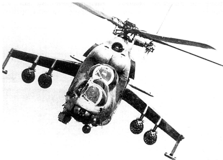
La Croatie disposerait aujourd'hui de 6 hélicoptères de combat MI-24 Hind.

Cette possibilité est évoquée par des officiers supérieurs yougoslaves qui soulignent que leur commandement est moins inquiet des limitations contenues