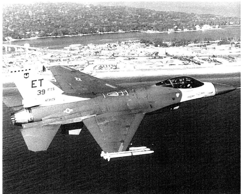
Le gouvernement croate a l'intention d'acquiescer des avions de combat F-16. Ici un F-16 A/B équipé du missile air-air ASRAAM.

Financées par l'Occident et le monde musulman, les forces armées croates et musulmano-croates de Bosnie-Herzégovine prendraient, non seulement un avantage qualitatif ; quantitativement, elles l'emporteraient également sur les forces yougoslaves.