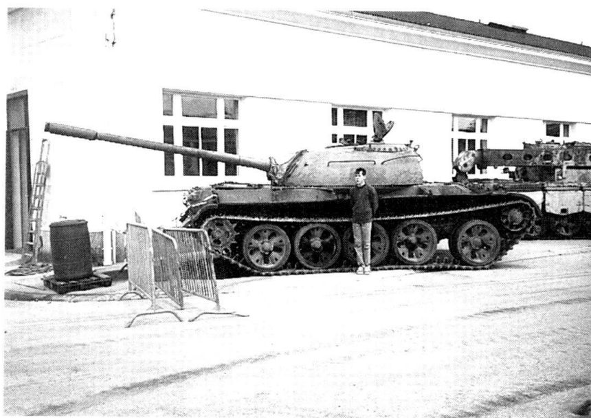
La République fédérale de Yougoslavie dispose aujourd'hui de nombreux chars obsolètes comme le T-54/55 photographié ici devant le Musée des blindés de Saumur.

Dans une deuxième phase, il va s'agir de contrôler la réalité des mesures de réduction des armements. La tâche des inspecteurs consistera à vérifier si les excédents ont bien été supprimés selon l'une des procédures prescrites. Enfin, troisième phase, on procédera au contrôle du respect des quotas prévus dans l'accord, ce qui devrait confirmer qu'aucune des parties n'a augmenté le niveau de ses armements au-dessus des seuils fixés.