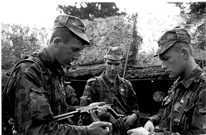
Exercice « Cooperative Bridge » (septembre 1994 en Pologne).

Autre signe de la fébrilité qui règne dans la capitale russe, certains députés « rouges-bruns » de la Douma, autour du parti d'extrême-droite nationaliste de Vladimir Jirinovski et des communistes de Guennadi