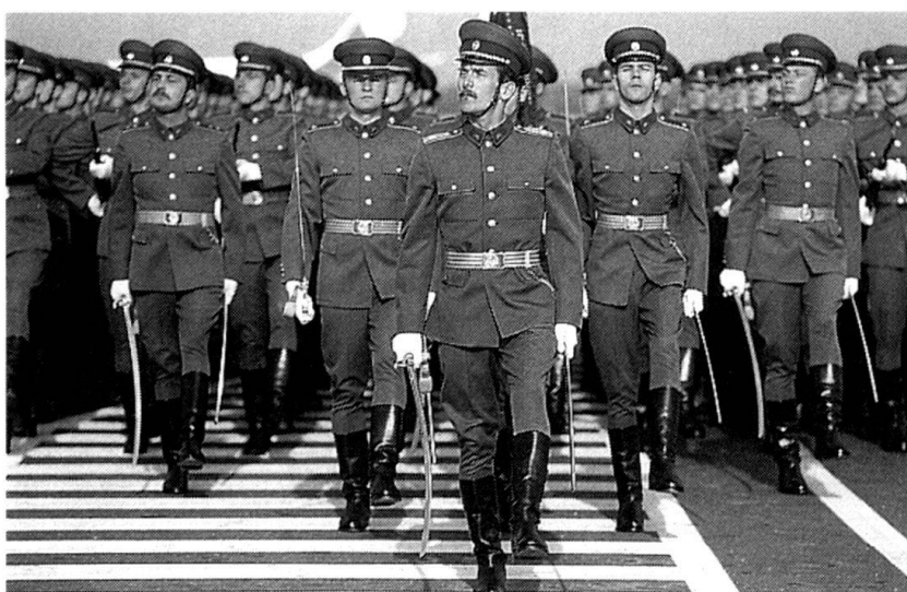
L'Armée Rouge, désormais partenaire de l'OTAN ? (Photo : Fernand Domange).

Parfois surnommée « la Suisse des Balkans » en rai-