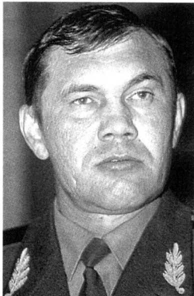
Le général Lebed.

Varsovie fera partie de la première vague d'élargissement, en avril 1999, avec Prague et Budapest. De tous les pays de la région, la Pologne est sans conteste celui où les enjeux géostratégiques sont les plus importants, ce qui s'explique par plusieurs facteurs. D'abord par la taille du pays