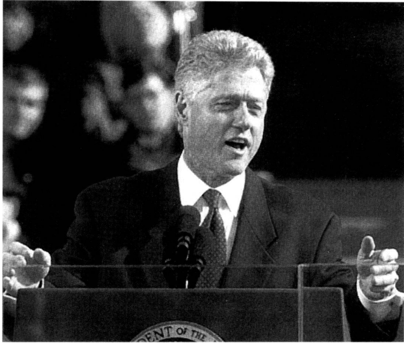
Un pont vers le XXI e siècle : Tels sont les propos de Bill Clinton pour son deuxième mandat à la présidence des Etats-Unis.

C'est la grande surprise de l'automne-hiver 1996-1997 : en congédiant définitivement par les urnes le président Ion Iliescu et sa clique d'ex-apparatchiks communistes agrippés au pouvoir depuis la vraie-fausse révolution de décembre 1989, Bucarest a fait, le 17 novembre 1996, un grand pas dans la bonne direction. Les victoires conjuguées d'Emil Constantinescu à la présidentielle et de sa mouvance chrétien-