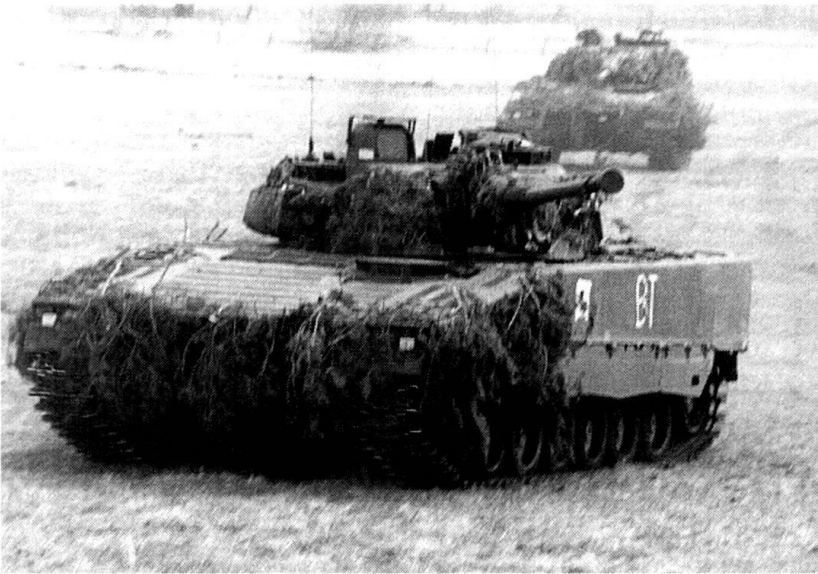
Les chars de grenadiers (ici le CV-90) sont en mesure de suivre les chars et de les appuyer par leur feu.

contre, le char est un élément inégalable : à deux reprises, malgré des pertes initiales élevées, un char seul a détruit une compagnie mécanisée adverse... en moins de dix minutes.