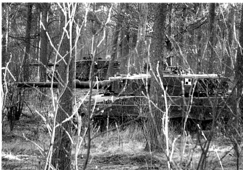
Feu et mouvement : les fauves attendent, observent...

L'entraînement en dehors des phases de combat proprement dites n'est pas négligé : la prise de secteurs d'attente en forêt ou près de zones urbaines, de même que le ravitaillement tactique (par camion-citernes sur une place de ravitaillement ou directement