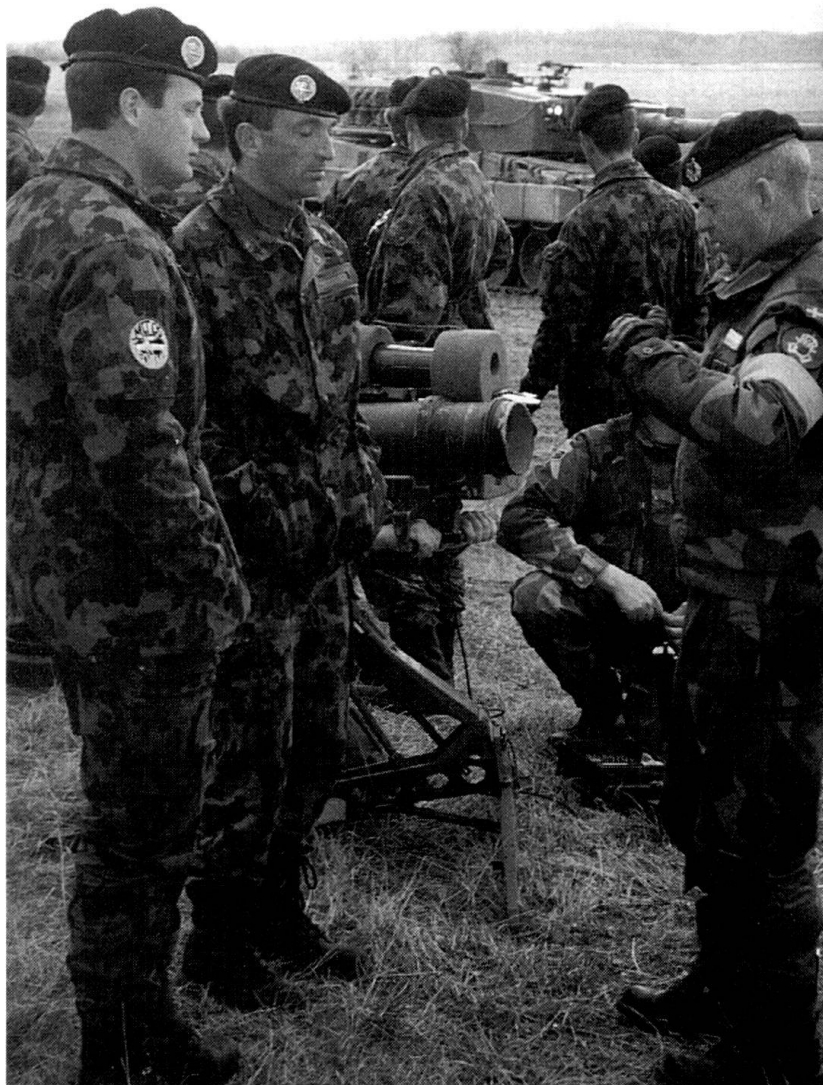
La collaboration entre instructeurs suisses et suédois, ainsi que des exercices réalistes et ciblés ont permis de créer les conditions favorables à notre engagement.