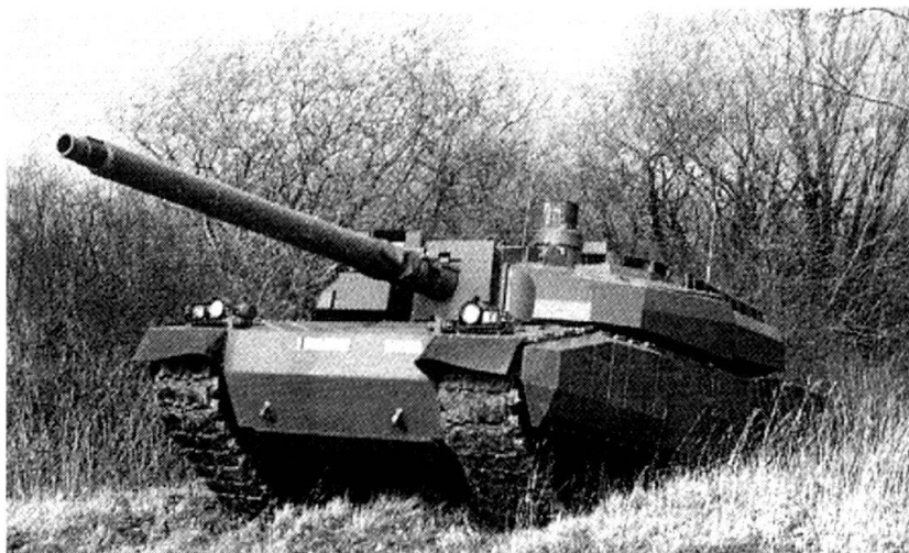
Le char Leclerc.

■ Pendant la Seconde Guerre mondiale, la Suisse accueille au total 29500 réfugiés juifs. Les Etats-Unis, combien de fois plus grands, refusent en 1938, comme la plupart des autres Etats, d'accueillir des réfugiés juifs. En 1940, ils renvoient le bateau Saint-Louis vers l'Europe avec 900 juifs et, en 1942, le Sénat