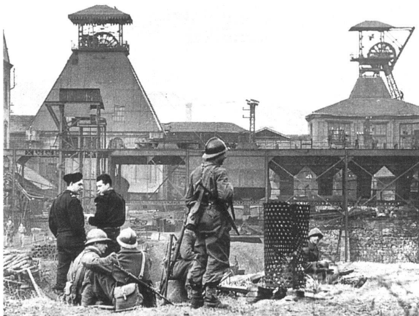
L'armée remplace les CRS en 1997. L'armée sur le carreau de la mine. Le gouvernement a dissous onze compagnies républicaines de sécurité complices des émeutiers.