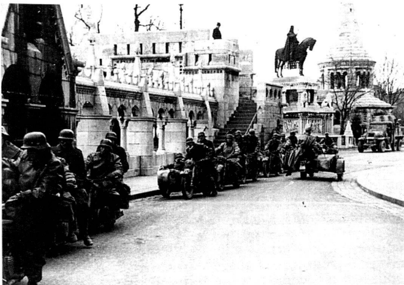
L'armée allemande occupe Budapest (19 mars 1944).

Si la Hongrie, qui jouissait d'un niveau de vie supérieur à celui de ses voisins semblait, de ce fait, mieux placée pour amorcer la transition vers l'économie de marché, les faits ont montré que le coût social était particulièrement élevé et que cette évolution ne se faisait pas sans douleurs. L'éclatement du carcan communiste a permis aussi la résurgence de « vieux démons », comme l'antisémitisme et un nationalisme forcené, qui a inquiété plus