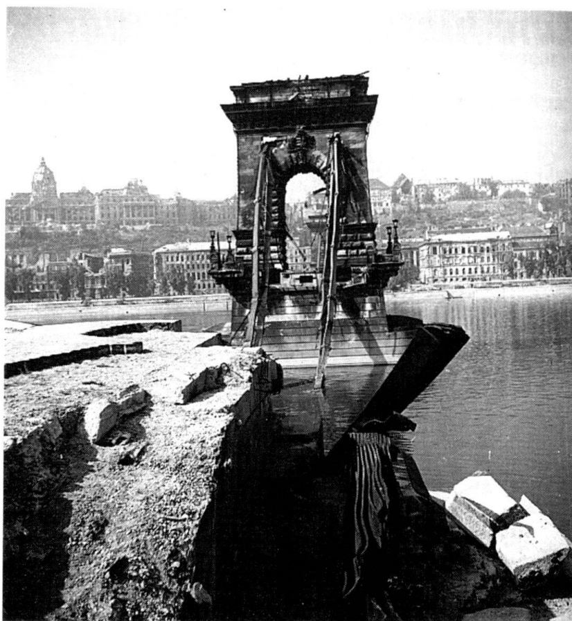
Le pont suspendu après le siège de Budapest (1945).

Cet événement tragique mais décisif dans l'histoire du mouvement communiste international marque le début de la fin de l'hégémonie soviétique dans le monde et, plus encore, la fin de l'idée même de communisme et de l'imposture qui