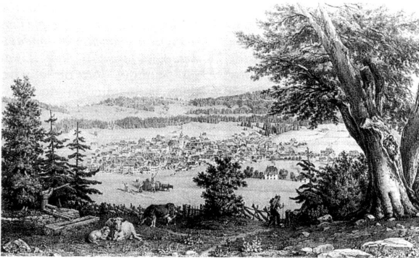
La Chaux-de-Fonds prise des Endroits en 1844, dessiné d'après nature par Henri Marthe, lithographie noir-blanc de A. Sonrel (MHC).

sieurs reprises dès 1831 de moderniser son administration et sa législation mais, outre les difficultés d'application engendrées par cette modernité naissante, il se heurte à la résistance d'une partie de la population neuchâteloise. En effet, si les Neuchâtelois respectent sans sourciller les droits du Roi et ceux de la Vénérable Classe (des pasteurs), ils ne voient pas d'un bon œil l'introduction d'impôts directs, jugés anticonstitutionnels et ne formant pas le fondement de l'Etat « qui depuis des siècles subsiste et prospère sans la ressource onéreuse des impôts » (1837). En revanche, l'industrie attend avec impatience de nouvelles structures administratives lui permettant de se développer sans contraintes.