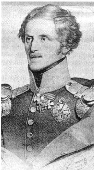
Le commissaire général de Pful.

Le tissu industriel neuchâtelois se concentre bien vite dans les Montagnes, par le développement de l'industrie horlogère; La Chaux-de-Fonds et Le Locle sont qualifiés de « nos deux grands centres industriels ». En 1847, l'horlogerie bas de gamme « fait vivre dans l'aisance une bonne partie du pays ». Le métier d'horloger évolue, au grand dam des pasteurs qui critiquent l'industrialisation des Montagnes. De paysan-horloger complet, l'ouvrier horloger s'est spécialisé selon la division du travail « par cupidité », disent les pasteurs: