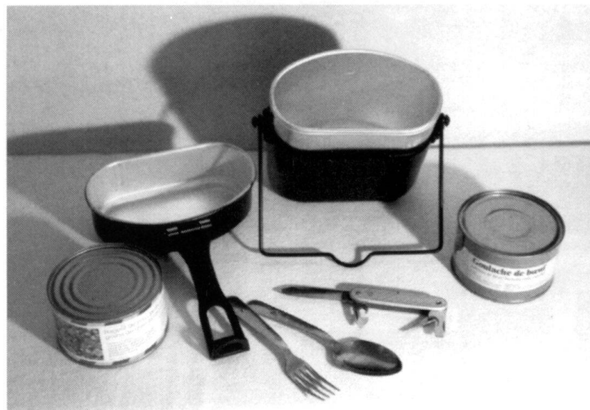
La gamelle! Fidèle compagne de plusieurs générations de soldats suisses!

Pour la boisson, l'Intendance de l'armée française met au point un concentré de vin rouge: le Vinogel! Cette marmelade en boîte additionnée d'un même volume d'eau, donne naissance à un semblant de vin rouge titrant environ 11°!