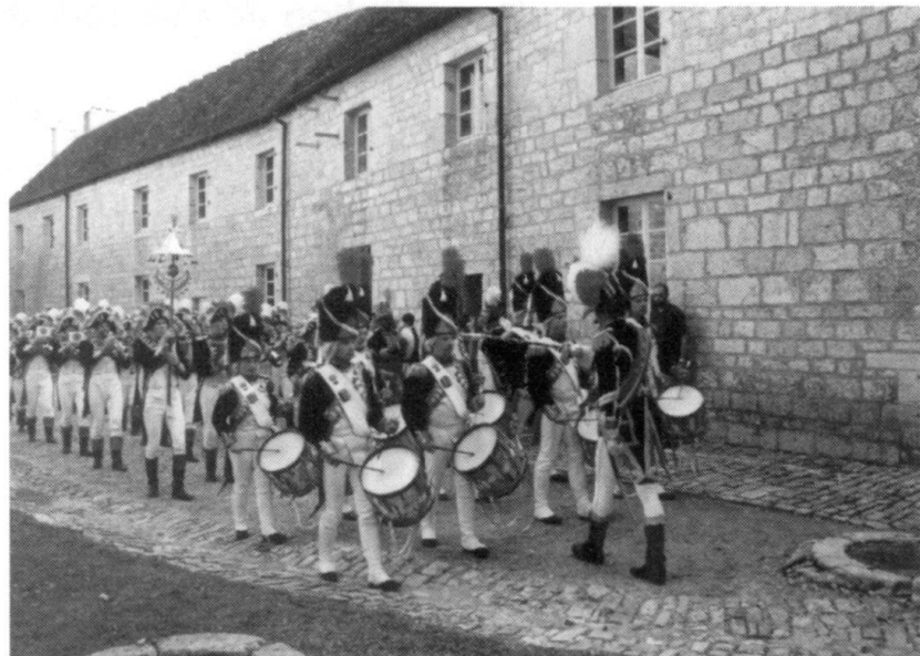
Musique napoléonienne. Durant les campagnes de Napoléon notamment, certains chefs de guerre faisaient allumer de nombreux feux de bivouacs inutiles afin de tromper l'ennemi sur les effectifs réels de leurs troupes!

Il n'est pas toujours possible (combat en cours, bombardements, camouflage, missions en territoire ennemi) de ravitailler le combattant de manière traditionnelle. Il doit alors se nourrir au moyen de rations individuelles, compactes et faciles à caser dans son paquetage ou dans sa tenue de combat. Les premières rations militaires comprennent de la viande séchée ou salée, des légumes et des fruits secs. Vers 1670, les Français établis au Canada découvrent le «pemmican», la ration de combat des Indiens. Cet aliment est constitué de viande de buffle séchée et de différentes baies. Les hommes rouges, par l'adjonction de fruits à cette préparation,