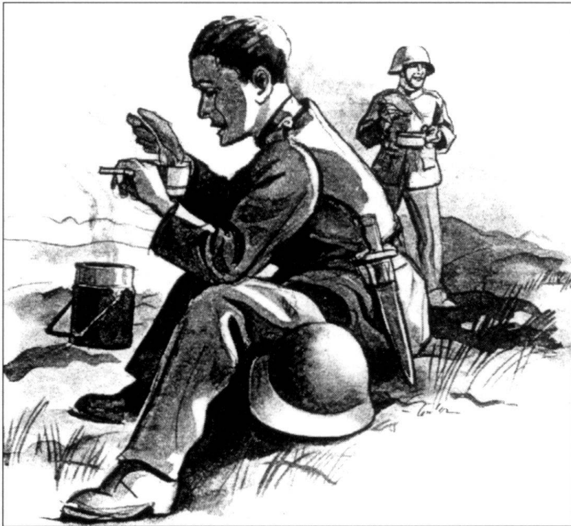
Impossible de partir en manœuvres sans son casque et sa gamelle! Publicité des Usines métallurgiques de Zoug parue dans l'Almanach de l'armée suisse, en 1939.

évitent ainsi, sans le savoir peut-être, les attaques du scorbut!