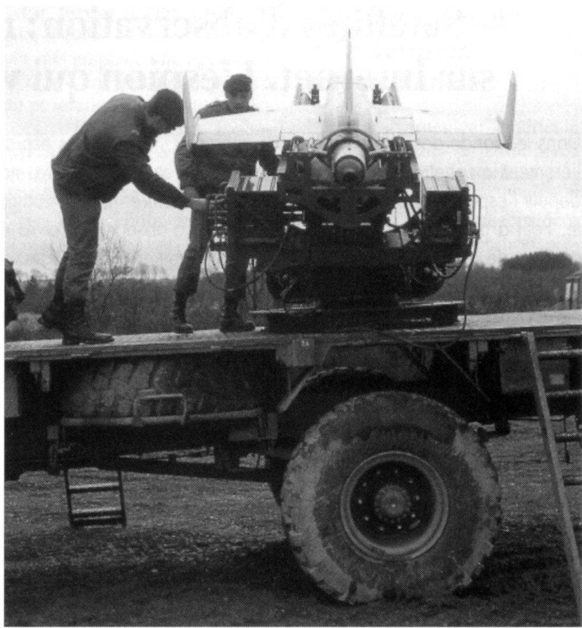
De nos jours, la reconnaissance aérienne repose encore principalement sur les avions et les drones. Ici, un engin Epervier.

En fait, les satellites KH sont avant tout destinés aux observations spéciales de la CIA. Près de quarante ans après les premières orbites de satellites espions, la reconnaissance des objectifs militaires repose toujours principalement sur les avions et les drones. Cette situation a posé de gros problèmes aux commandants des unités engagées dans le Golfe et en ex-Yougoslavie. Les militaires américains exercent une pression croissante sur le Pentagone afin de disposer d'une constellation de petits satellites bon marché, susceptibles de fournir en direct une information utilisable par les unités sur le terrain. Les études de faisabilité sont en cours, mais les USA n'envisagent par de système opérationnel avant... 2010.