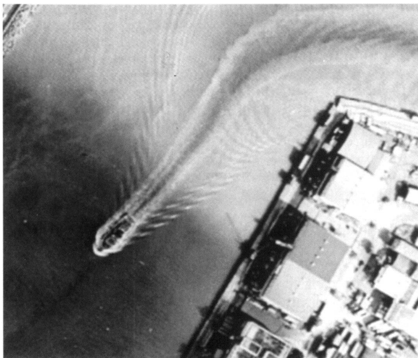
Vue du port de Kobe, au Japon. La photo a été améliorée par ordinateur sur base de documents multispectraux ainsi que d'images panchromatiques à haute résolution ( \pm 1 m).

archivées, ce qui permet au client d'étudier l'évolution d'une zone.