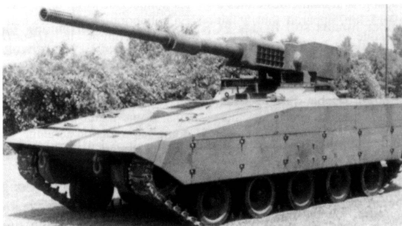
Version possible d'un char de combat dans le futur selon General Dynamics. Il ne faut plus qu'un équipage de deux hommes...

Comme arme secondaire, un canon laser stabilisé, très précis et d'une grande efficacité sert à combattre les hélicoptères, les drones, l'infanterie et les missiles guidés. Le canon laser offre l'avantage d'une importante autonomie logistique. L'objectif est tout d'abord saisi par un rayon laser de faible intensité qui détermine la distance et le point d'impact. Ensuite, l'arme émet un rayon de forte intensité qui provoque la destruction de la cible. La technique laser