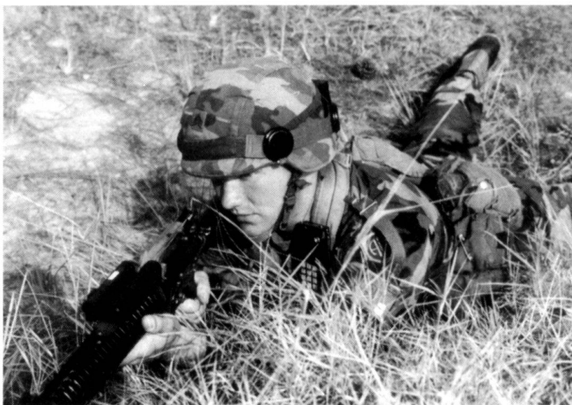
Un sous-officier de la 82 e division aéroportée à l'entraînement avec le Combat Simlas plus (Photo: Oerlikon Contraves Defence).

L'entreprise s'applique actuellement à réduire le poids et le volume des appareils. Il n'est pas impossible que les senseurs et la masterbox soient