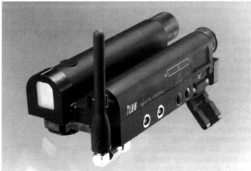
L'unité laser est montée sur le centre de gravité de l'arme.