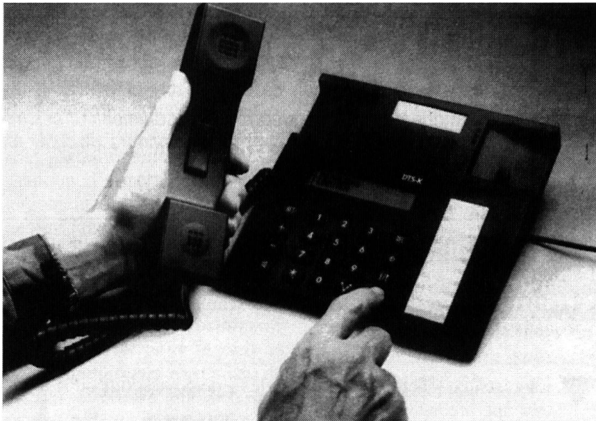
Le modèle conçu pour l'engagement militaire dans un abri, le DTS-K, est basé sur la conception civile. Tout en disposant des mêmes fonctions que le DTS-G, le modèle est moins cher.

récents. Les stations d'abonnés numériques (DTS) offrent tout le confort des téléphones civils: affichage pour le guidage-utilisateur, fonctions de numérotation abrégée et répétition, renvoi d'appels, double appel, conférence, etc.