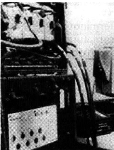
Commutateur nodal pour les équipements de commutation nodale: nombreuses liaisons pour faisceaux, peu de terminaux (abonnés).

récents. Les stations d'abonnés numériques (DTS) offrent tout le confort des téléphones civils: affichage pour le guidage-utilisateur, fonctions de numérotation abrégée et répétition, renvoi d'appels, double appel, conférence, etc.