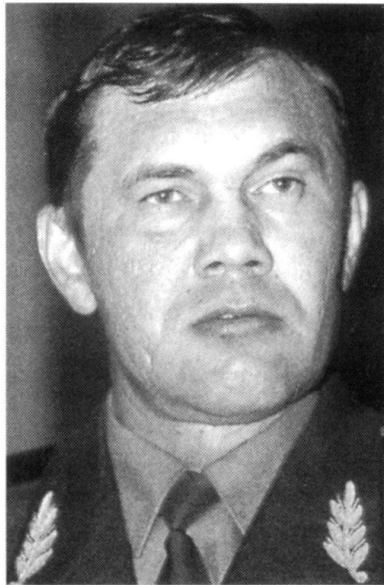
Le général Lebed serait-il ce leader à poigne, capable de remettre de l'ordre en Russie et de redonner la fierté à ses habi-

En Occident, les dangers les plus graves actuellement n'ont plus rien à voir avec ceux de la guerre froide ou du terrorisme classique. Trafic de stupéfiants, de substances nucléaires, d'individus, de composants électroniques sensibles, d'armes, fanatismes religieux, ethniques et tribaux, guerres civiles, famines, piraterie, voilà quelques-unes des menaces à la paix et à la sécurité internationale. Dans un tel contexte, les conceptions de défense nationale et de sécurité intérieure doivent s'adapter. Il faut mener le combat contre