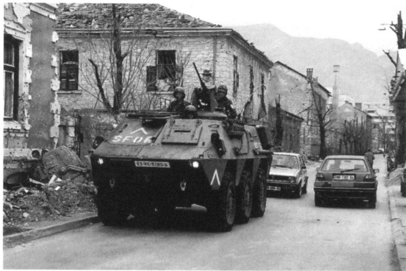
La Bosnie, à l'ouest d'une «zone de tempête» qui s'étend jusqu'en Chine...

Aux portes de l'Europe occidentale opèrent des milices, des guérillas mutantes, entités hybrides formées de terroristes, de «bandits patriotes» et de militaires déserteurs, commandées par des généraux dissidents, des «seigneurs de la guerre» ou de purs et simples bandits. Ces gens ignorent superbement les lois internationales, spécialement celles qui relèvent du respect de l'humain. Un continuum sans précédent guérilla – narco-traffic – terrorisme – mafia s'est désormais constitué.