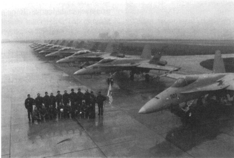
Former un pilote exige entre cinq et sept ans...

délinquance. Au cours des années 1980, des bandes se forment, qui contrôlent un quartier, une cité. Quand la répression commence à partir de l'été 1991, des contacts se nouent entre ces «mauvais garçons» et les «salafistes»: les voyous disposent de papiers dont les moujahidines ont besoin, les seconds possèdent des armes qui manquent au milieu algérien.