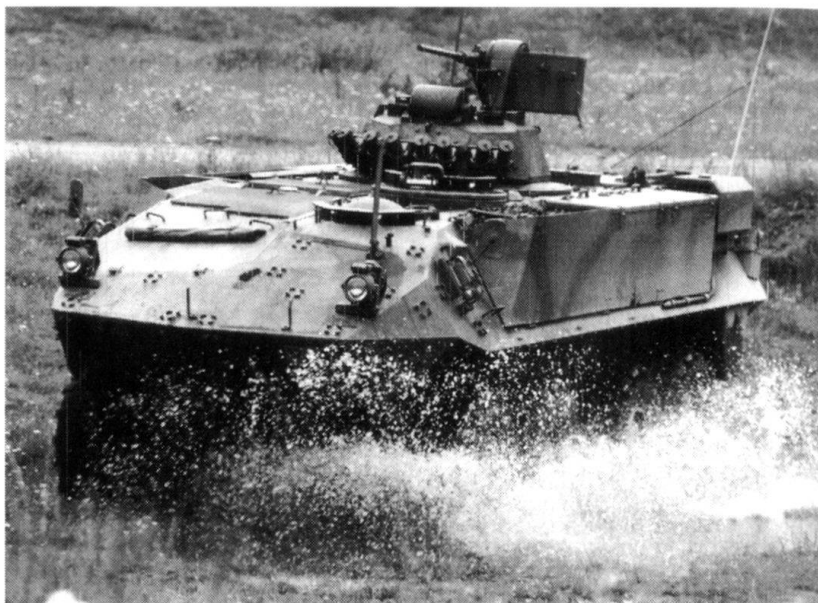
Char de grenadiers Piranha 8 x 8.

ELTAM permet d'exercer librement le combat de deux formations mécanisées adverses, des bataillons de chars ou des parties de ces derniers, sur un terrain généré par ordinateur d'une surface de 90 km carrés. Les exercices ne sont pas prédéterminés de manière rigide; ils évoluent en fonction du comportement des deux formations exercées. Le simulateur permet de représenter au maximum 400 «objets» en interaction, par exemple des chars, des sections, des éléments d'exploration.