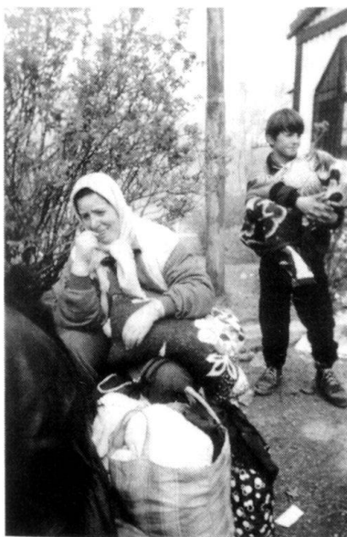
La détresse des réfugiés est lisible sur leur visage.

Un beau matin du mois de juillet 1998, nous rencontrons des milliers de réfugiés en provenance du Kosovo, qui, dans des conditions inimaginables,