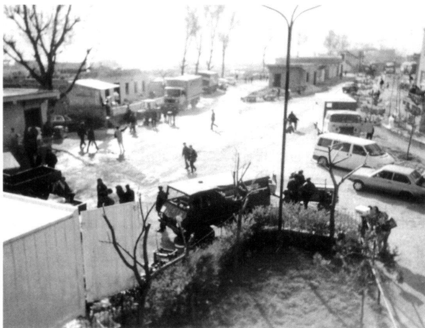
Véhicule militaire suisse, utilisé par l'Armée de libération du Kosovo, ici à 5 km à vol d'oiseau de la frontière.