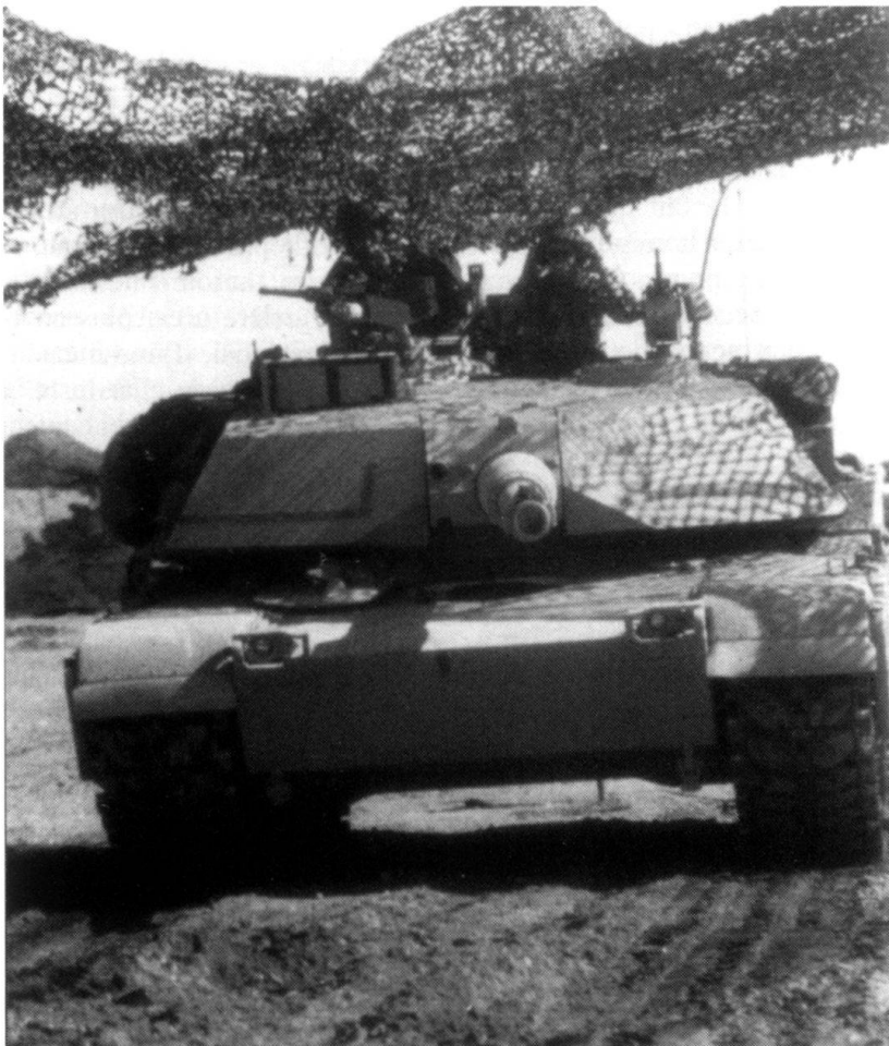
Char de combat M1-A1 en position.

Le Groupement de l'armement (GDA) estime alors le coût unitaire du véhicule, sans la recherche et développement, entre 2,1 et 3 millions de francs. Cette estimation est beaucoup trop optimiste, car elle table sur une production de 1000 à 3000 véhicules, alors que l'armée prévoit d'en acquérir 400 à 450 tout au plus. En 1978, le coût du projet se monte déjà à 68 millions; il nécessitera, dès 1979, 20 millions supplémentaires par an. L'industrie estime le coût global du développe-