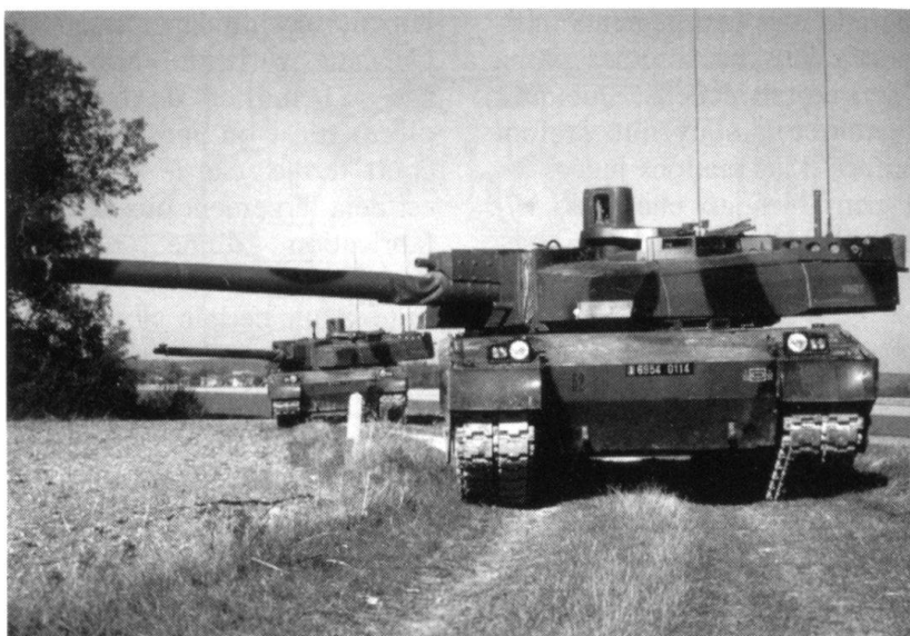
Leclerc en position de tir.

Aux Etats-Unis, divers concepts sont actuellement étudiés pour remplacer le M1 Abrams à l'horizon 2020-2030. 3 Mais la plupart d'entre eux visent à mettre au point un Armored Gun System (AGS) et non un char de combat, un euphémisme qui en dit long sur des résultats peu concluants et ser-