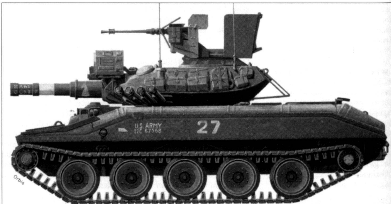
M-551 Sheridan, «dessin d'artiste».

Au début des années 1960, les engins filoguidés antichars à charge creuse annoncent une révolution dans le combat terrestre. A l'Ouest comme à l'Est, de nombreux véhicules sont mis au point pour exploiter cette arme nouvelle. Développé à