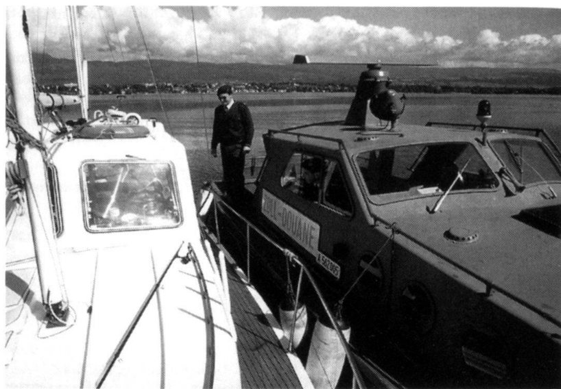
Les gardes-frontière suisses en action, sur l'eau...

pes concernées, partant leur aptitude à remplir leur mission primaire. Avec l'Exposition 01, qui nécessitera l'engagement échelonné de 15 régiments, l'aide apportée à de multiples autres manifestations civiles, la situation n'a aucune chance de s'améliorer. Le rédacteur du Bulletin de la Société militaire genevoise le soulignait déjà en mai.