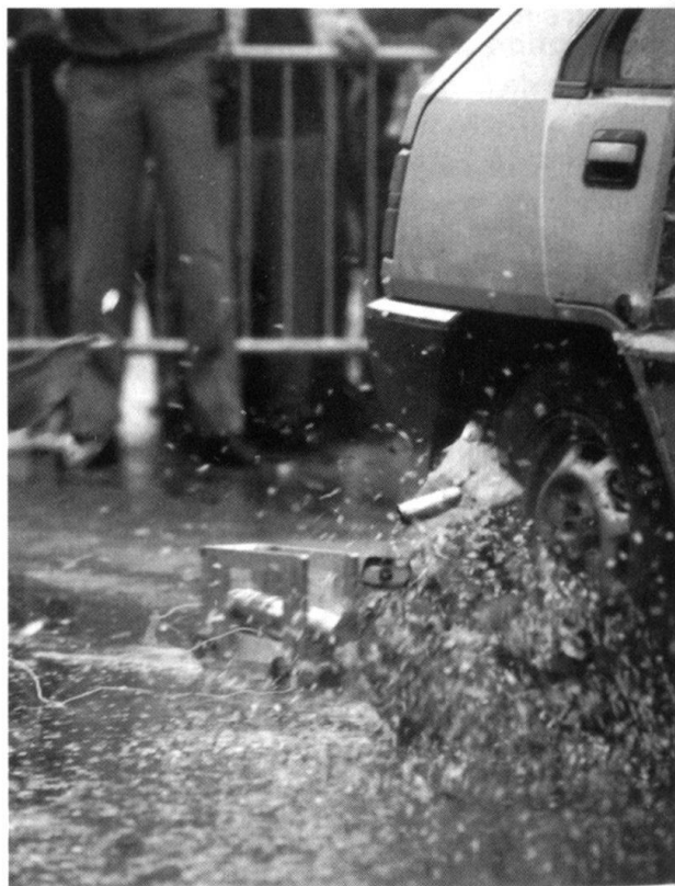
Le Groupe des spécialistes en dépiégeage de la Police cantonale vaudoise en action. Un objet suspect, placé sous une voiture, est neutralisé avec un disrupteur (canon à eau).