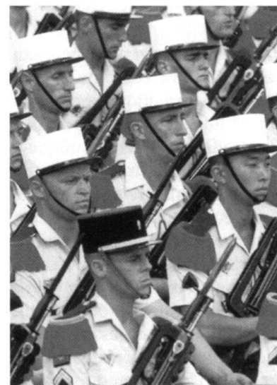
Défense ou sécurité?

ques dans le Caucase, en ex-Yougoslavie et en Afrique dans les années 1990, sans parler de l'interminable guerre israélo-arabe, nous avons une préfiguration de l'avenir. Des ethnies trop différentes ne peuvent cohabiter; de plus, l'islam conquérant ne veut que la première place. Même dans une société laïque de tradition chrétienne comme la France, l'islam est, non seulement la deuxième religion, mais il a réussi là où le catholicisme a échoué: il a cassé la laïcité. Alors qu'en France, les lois de 1936 interdisaient le port de marques religieuses à l'école publique, l'islam les a imposées avec le tchador. Certes, il a bénéficié de la complicité de certains membres du Conseil constitu-