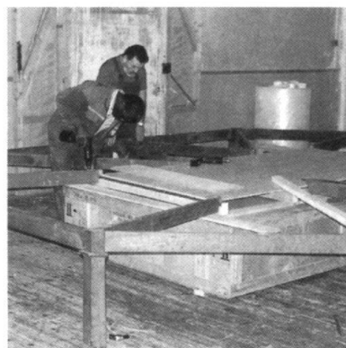
Montage d'un piétement de plan-relief.

Sont encore présentés Antibes, avec le Fort-Carré de Henri III et les remparts de Vauban enfermant la vieille vil-