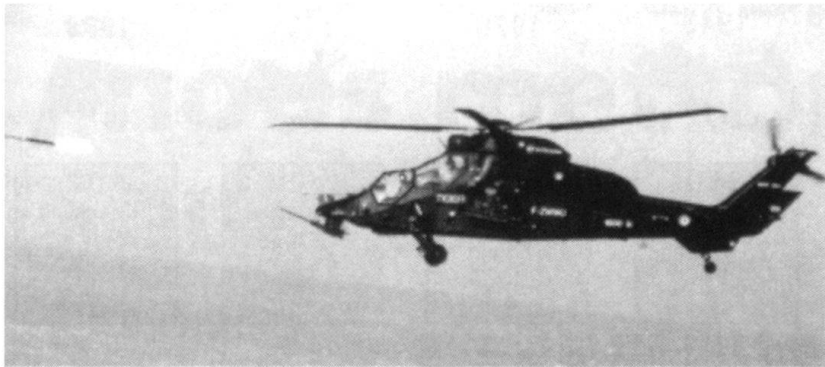
Tir de Mistral par un Tigre.