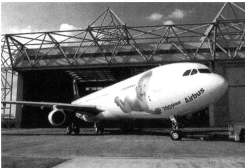
Le 2001 e Airbus sorti de la firme Aerospatiale Matra .

Le 29 mai 1999, le 2001 e Airbus produit a été présenté à l'usine Clément Adler. Né en 1992 de la fusion des activités d' Aerospatiale et de Dasa , Eurocopter est le premier constructeur mondial d'hélicoptères, qui occupe 9 500 personnes, principalement en France et en Allemagne. Eurocopter est présent dans le monde avec plus de 8 300 hélicoptères en exploitation dans 132 pays, soit le 30% du marché