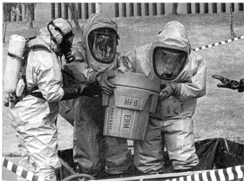
Guerre bactériologique, après les attentats du 11 septembre à New York et Washington.

Les civilisations ne sont pas des entités hiérarchisées; elles réagissent chacune comme un tout. Un conflit mineur, voire local peut rapidement dégénérer en une crise majeure. L'intervention de l'OTAN contre la Yougoslavie a rendu la situation géostratégique plus claire mais plus instable. Des réactions en chaîne ou autres «effets papillon» restent toujours possibles 19 !