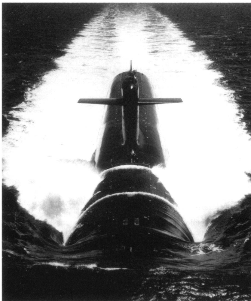
Sous-marin nucléaire lanceur d'engins, le Triomphant.

Le génie génétique offre à la guerre bactériologique, non seulement une vaste gamme d'agents pathogènes, mais des