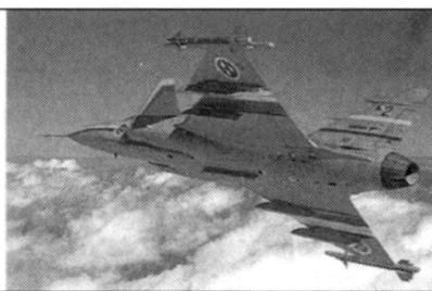
JAS 39 Gripen.

possibilités effrayantes, comme l'inclusion de la dimension temporelle dans l'action de l'agent: la stérilisation progressive, sur plusieurs générations, d'un groupe ethnique ciblé 12 .