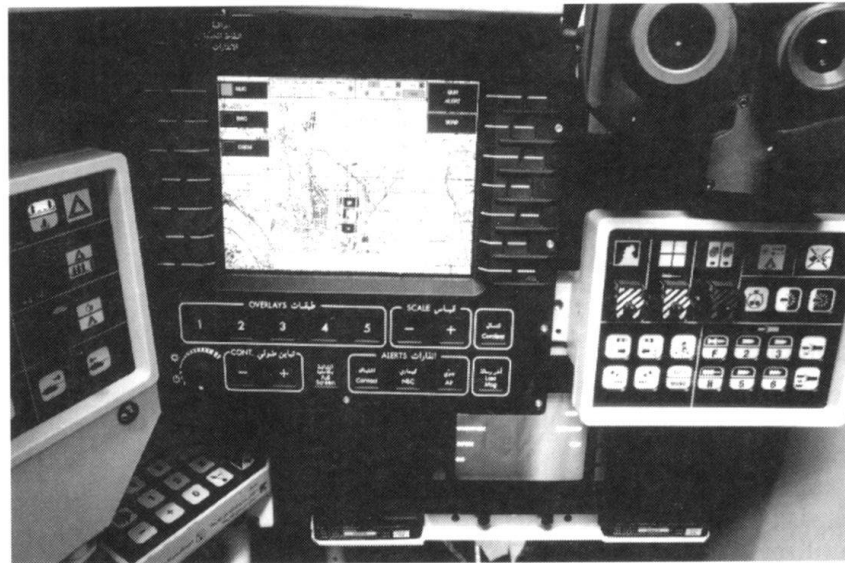
Révolution dans les affaires militaires: tout savoir de ses troupes et de l'ennemi. Ici, la place du commandant sur le char français Leclerc, avec son système d'aide au commandement.

En effet, les services de renseignements occidentaux, par leurs structures et leur pouvoir d'analyse, sont plus aptes à apprécier les intentions d'un Politburo soviétique (qui n'existe plus), à compter des systèmes nucléaires stratégiques et des divisions blindées qu'à évaluer le type de crises qui prédomine aujourd'hui. Ne parlons même pas de détection!