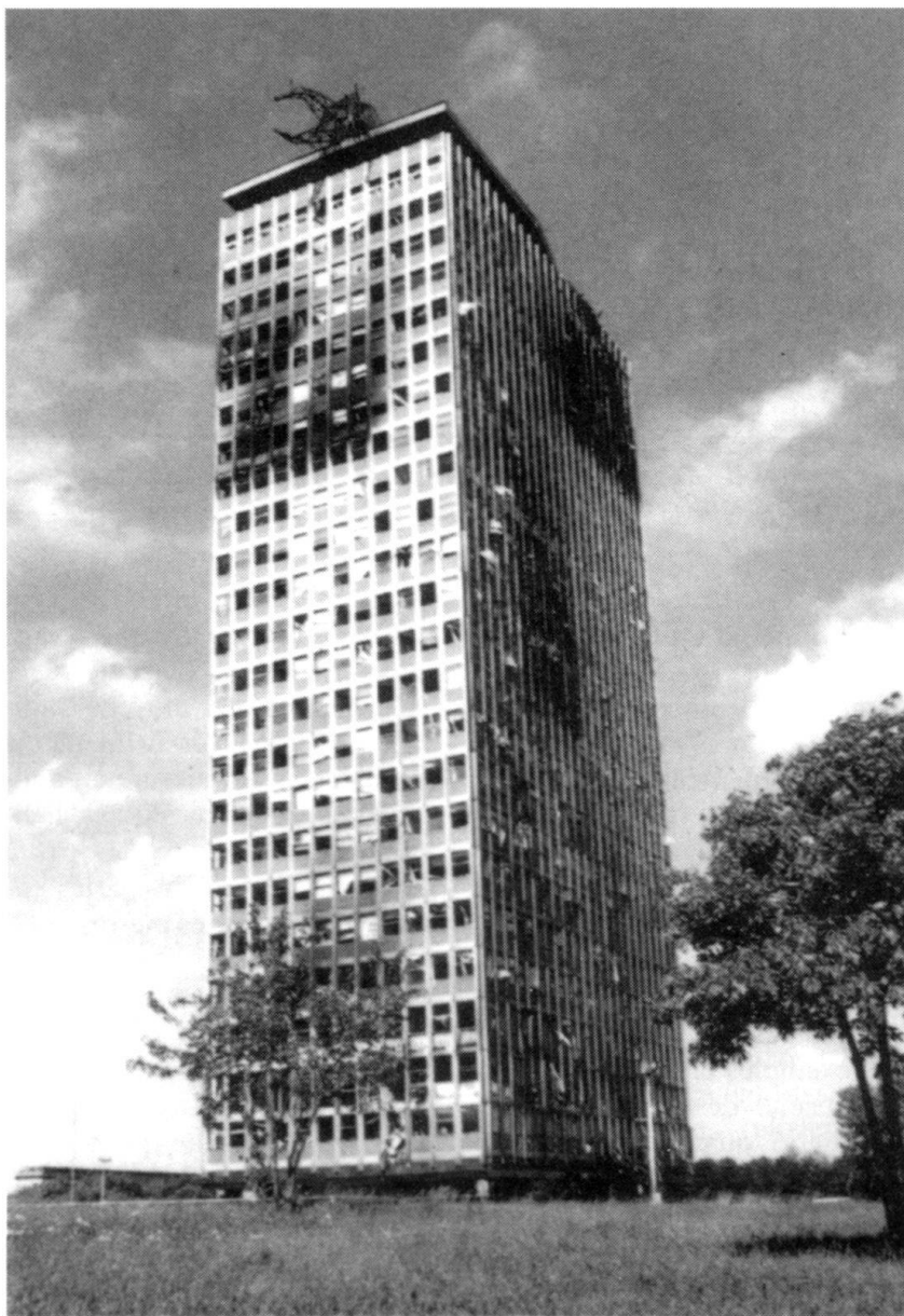
Frappée «chirurgicale» sur l'immeuble du Parti communiste yougoslave.

Les moyens civils sont quasiment inexistantes. Faire du Peacekeeping demande des soldats capables de fonctionner comme des policiers, un travail pour lequel ils ne sont ni formés, ni entraînés, ni équipés. Malgré ce constat, la création d'un corps international de police a échoué 10 . Au niveau de la reconstruction, le peu d'unités