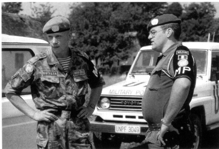
Partenariat pour la paix et maintien de la paix: un Russe et un Belge collaborent au Kosovo...

les faiblesses de l'instruction, particulièrement l'instruction au combat de nuit.