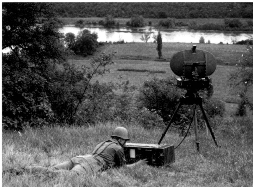
... Un Rasit français (Radar de surveillance du sol et d'aide à l'artillerie).

«Le soldat n'est pas homme de violence. Il porte les armes et risque sa vie pour des fautes qui ne sont pas les siennes. Son mérite est d'aller au bout de sa parole, tout en sachant qu'il est voué à l'oubli.»