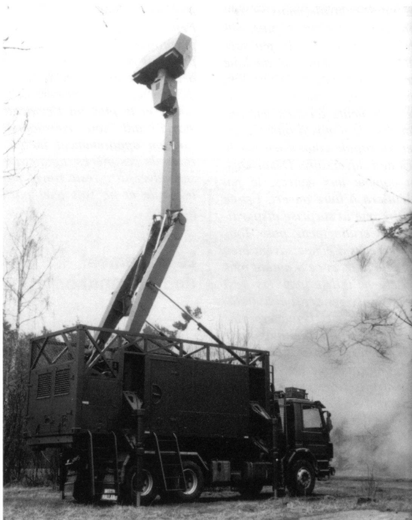
Les censeurs, capteurs et radars de surveillances ont rendu le champ de bataille lisible. Ici un radar suédois Giraffe couplé à un système C3I...

Selon le colonel Hubin, il faudra demain distinguer trois