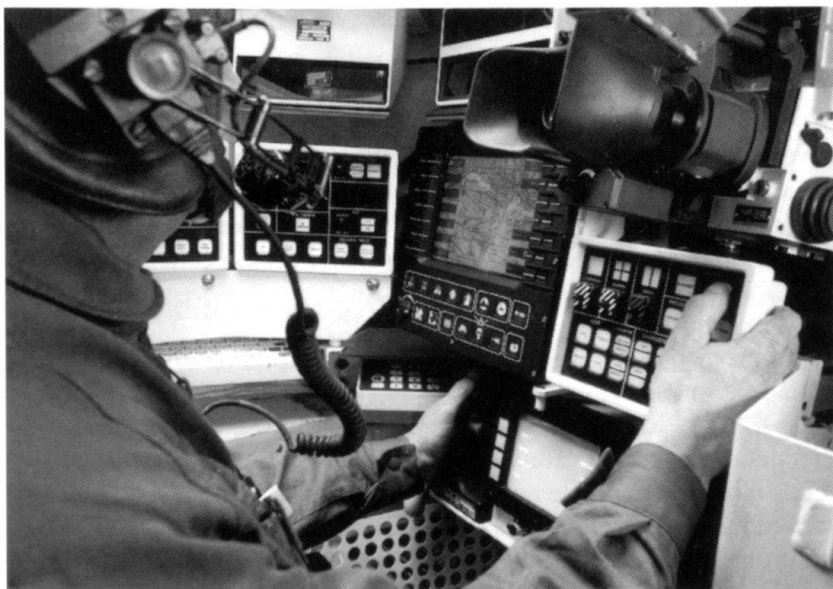
Le système d'aide au commandement du char de combat Leclerc.

Naturellement, les ressources de l'informatique devraient faciliter la chose, mais il faudra admettre que la part de travail consacrée à cette question devra augmenter considérablement. Cette charge de travail va prendre une ampleur considérable à l'échelon conduite, celui qui coordonne, s'assure de la cohérence des actions en cours, et probablement contribuer à modifier complètement