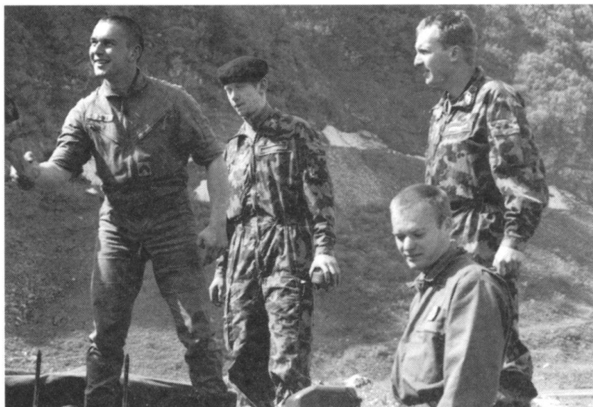
Sous-officier adjoint de peloton remerciant un sous-officier suisse sur la tourelle d'un Leopard.

Si les Suisses ont trouvé en France des conditions excep-