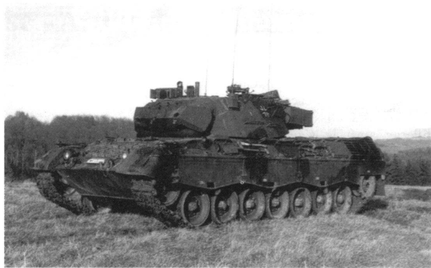
Char d'observation Leopard 1 A5.

canisées 2 . Ainsi l'appui de feu est assuré, quelles que soient les conditions de combat. Si l'arme principale du Leopard a été démontée, l'optique stabilisée, avant tout l'appareil de pointage avec son amplificateur de lumière et son télémètre laser, continuent à être utilisées pour l'observation et la détermination des buts. Le char d'observation dispose en plus d'un système de navigation hybride très précis pour la détermination de la position et de la direction, ainsi qu'un système d'exploitation et de transfert des données.