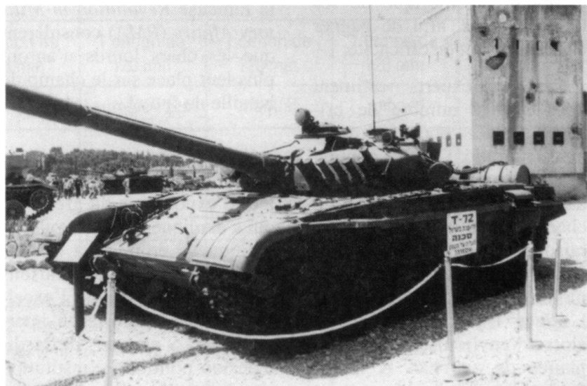
Le principal adversaire du Merkava, le T-72.

Actuellement, Tsahal met en œuvre près de 1200 Merkava