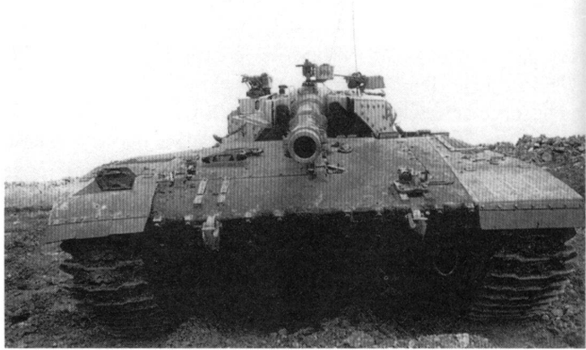
Le Merkava de face, photographié au grand angle.

En milieu de journée, la force d'invasion israélienne franchit la rivière Litani. Les Casques bleus, confinés sur ordre dans leurs blockhaus, assistèrent sans pouvoir réagir à la progression des unités israéliennes en direction de Nabatieh et du château de Beaufort; ce dernier devint rapidement la cible de l'artillerie et des chars israéliens. Ils notèrent également dans leurs rapports la pré-