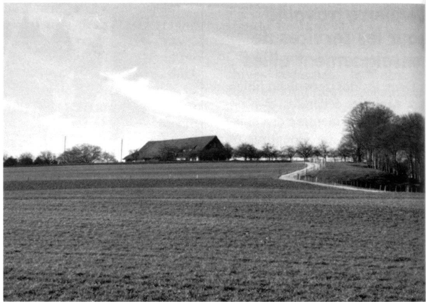
Ferme de Waldegg au-dessus de Porrentruy.