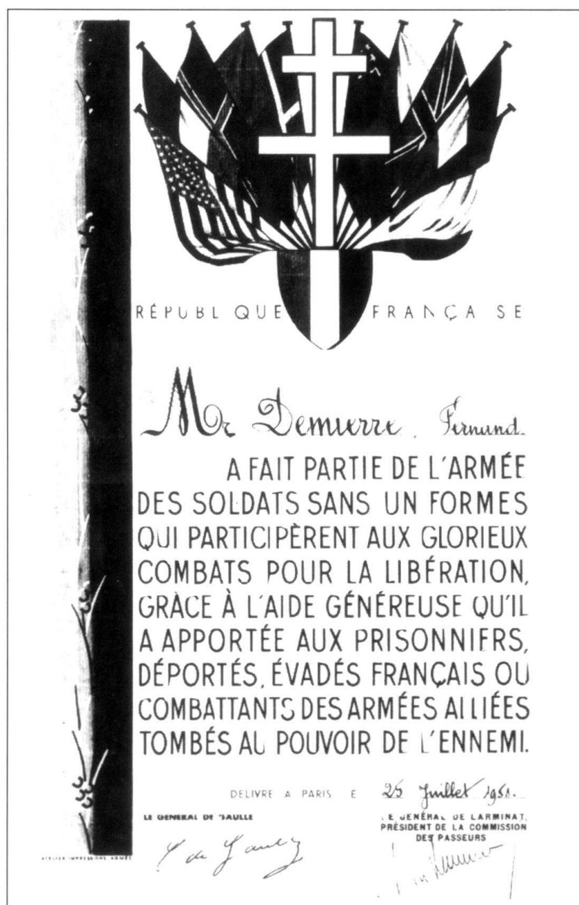
Certificat signé « de Gaulle ».

En septembre 1940, deux jeunes résistants, venant de Paris, pénètrent en Suisse par la Dôle; ils se rendent à pied à Rolle et, de là, en auto-stop à Genève; ils sont interceptés, alors qu'ils se sont fait éconduire par le Consulat britannique, et incarcérés aux violons de poste