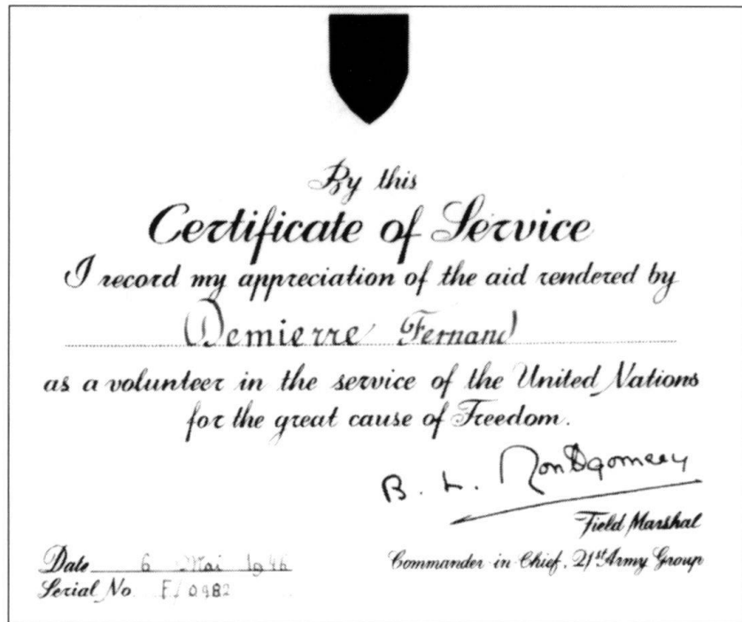
Certificat signé «Montgomery».