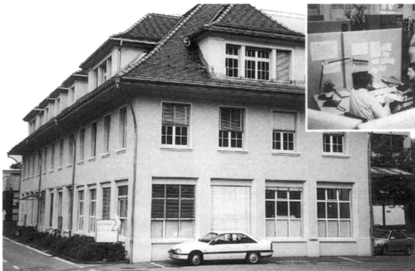
La « Maison Armée XXI » à Berne où se planifie la nouvelle armée.

sera renouvelé. Le renouvellement du reste du matériel de corps est évalué avant la fin de la période d'utilisation. La réserve est organisée en formations. Les officiers supérieurs et les capitaines suivent, chaque année, au maximum 5 jours de cours de perfectionnement. La réserve donne une grande liberté de manœuvre.