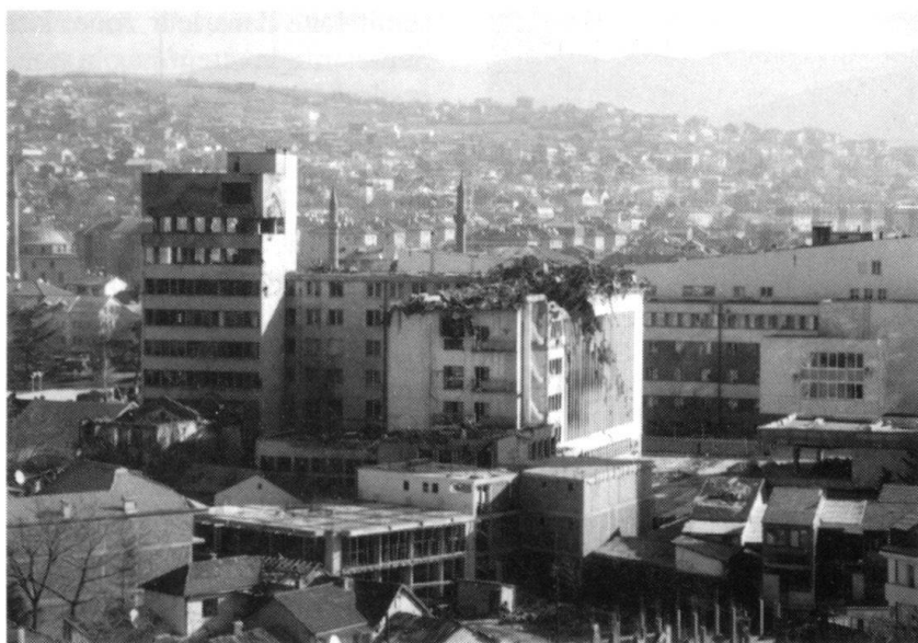
Le bâtiment de la poste de Pristina, un des seuls objectifs de la ville « traité » par un missile de croisière tiré depuis un navire de guerre en Méditerranée.