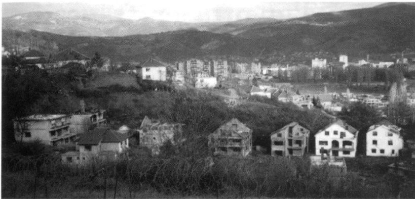
Mitrovica: le point dominant « Montségur ». En contre-bas, des maisons détruites habitées naguère par des riches Albanais au nord de la rivière en zone serbe. A « l'époque yougoslave », Mitrovica n'avait que des quartiers multi-ethniques.

AMX-10 se trouve une vitrine derrière laquelle des Serbes observent continuellement la petite garnison. Les hommes qui ne sont pas engagés, se trouvent dans une petite pièce quelques mètres derrière le barrage. Le confort n'est pas au rendez-vous!