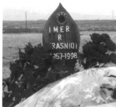
Quelque part entre Pristina et Prizren, la tombe d'un « héros » de l'UCK.

Quoi qu'il en soit, c'était la première fois que les Albanais s'attaquaient directement aux forces françaises qu'ils considéraient comme favorables aux Serbes, vraisemblablement par-