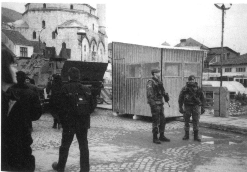
Prizren: un poste de contrôle allemand sur un pont.

mois au Kosovo, les cadres et les soldats français font des relèves de quatre mois, sauf les officiers qui servent dans des états-majors de la KFOR (six mois). Pour les préparer, il faut un mois d'instruction, également un mois pour la remise en condition après le retour au pays. Cette solution donne du temps pour faire de l'instruction de base pour assurer l'engagement primaire des for-