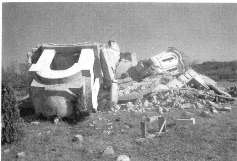
...Si l'église orthodoxe n'est pas gardée, elle risque fort d'être dynamitée et incendiée! (Photo: Lubomir Kotek).