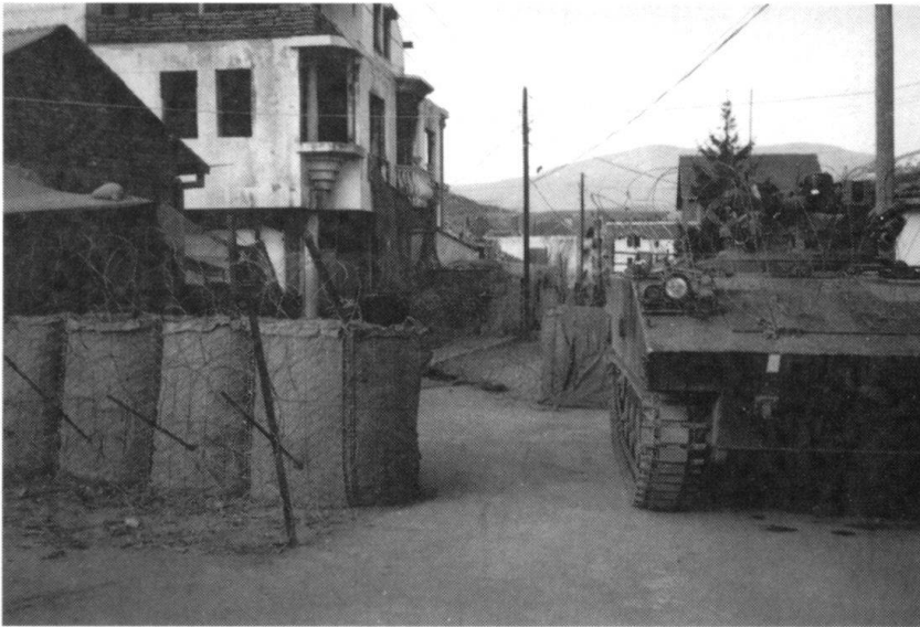
Mitrovica: un poste de contrôle français dans le quartier de la « Petite Bosnie ».

mière ligne tant que, parmi les manifestants, il n'y a pas d'armes. Lorsque les pierres, les projectiles ou les billes d'acier des frondes pleuvent, ils mettent le casque et prennent leur bouclier. En cas de coups de feu ou s'ils se trouvent débordés, ils se replient et la troupe prend la relève. Cette doctrine permet de prendre des mesures graduées et de respecter la proportionnalité si chère aux juristes.