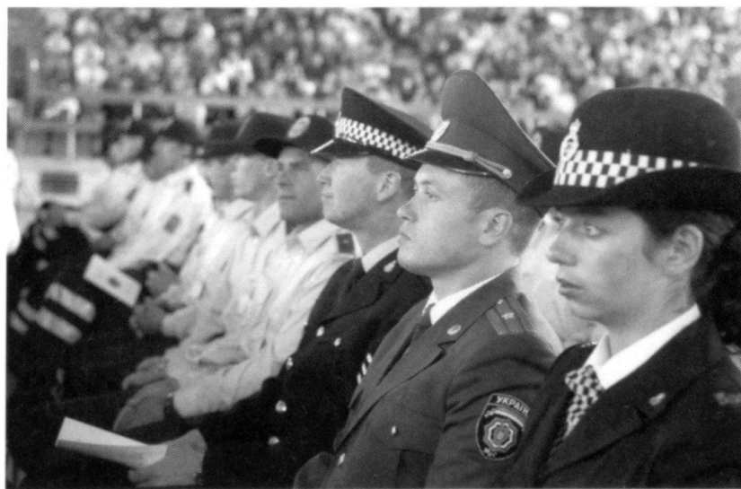
Policiers internationaux chargés de former la police au Kosovo.

La collaboration entre la Mission des Nations unies au Kosovo et celle de l'OSCE pose parfois problème, ce qui est tout à fait naturel. Des rumeurs naissent, bien entendu incontrôlables. Au sein de l'ONU, plusieurs Etats seraient «opposés» à l'OSCE. Les Russes, plutôt favorables aux Serbes, chercheraient à diminuer l'influence de l'OSCE, qui vise à établir au Kosovo un système de démocratie à l'occidentale, et à «saboter» son travail. Ils soutiendraient l'ONU au sein de laquelle leur influence serait plus forte et ils verraient d'un