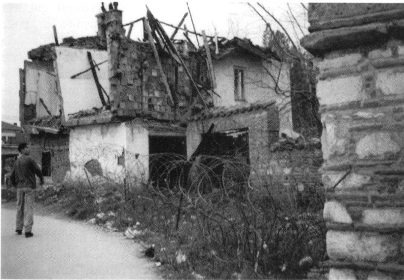
Prizren: l'incendie intentionnel, un moyen d'épuration ethnique.

ce que ceux-ci ont refusé un élargissement de la «zone de confiance» au nord de la rivière et qu'il n'y a aucun progrès dans la région à cause de l'extrémisme dans les communautés dominantes.