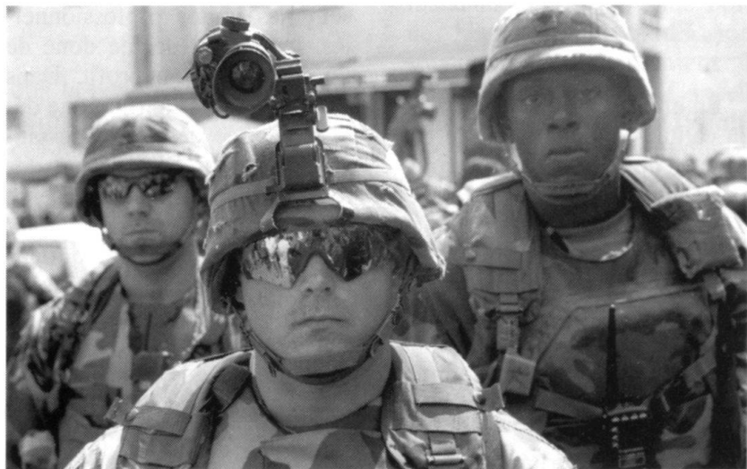
Une photo significative: ces soldats américains, équipés high tech, ne sortent de leur camp que lorsque des mesures assurant le « zéro mort » ont été prises. Après l'attentat du 16 février, il a fallu attendre 3 heures pour qu'un hélicoptère vienne survoler la zone....