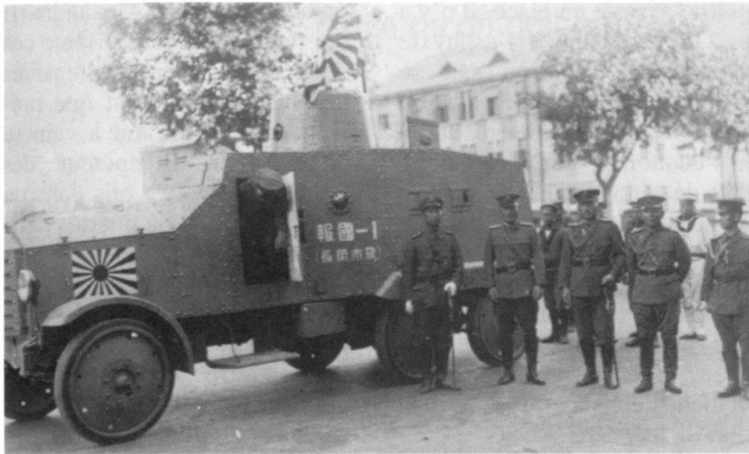
Des troupes d'élite japonaises, quelque part en Chine, surveillent l'un des rares blindés de l'armée japonaise d'avant-guerre.