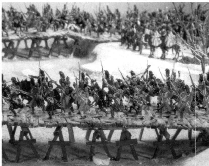
Passage de la Bérézina, 25-28 novembre 1812 (Morges, Musée de la figurine).

il faut désormais «nourrir» les armes et les machines. Encore sous le Premier Empire, une troupe peut combattre par le fer si les munitions manquent ou si la pluie l'y oblige. Ce n'est plus le cas aujourd'hui, puisque la capacité de combat d'une troupe se mesure aux munitions qu'elle dispense. Le 7 mai 1954, les 10000 hommes de la garnison française de Dien Bien Phû se rendent au Viêt Minh après avoir épuisé leurs munitions. Un combat à la baïonnette aurait semblé suicidaire. Dien Bien Phû s'avère une défaite logistique française. Dans les mêmes conditions de siège et d'encerclement, Khe San (1968) est une victoire de la logistique américaine. La sur-extension logistique arrive quand l'intendance ne suit plus. C'est alors qu'intervient «la force décroissante de l'attaque» mise en évidence par Clausewitz.