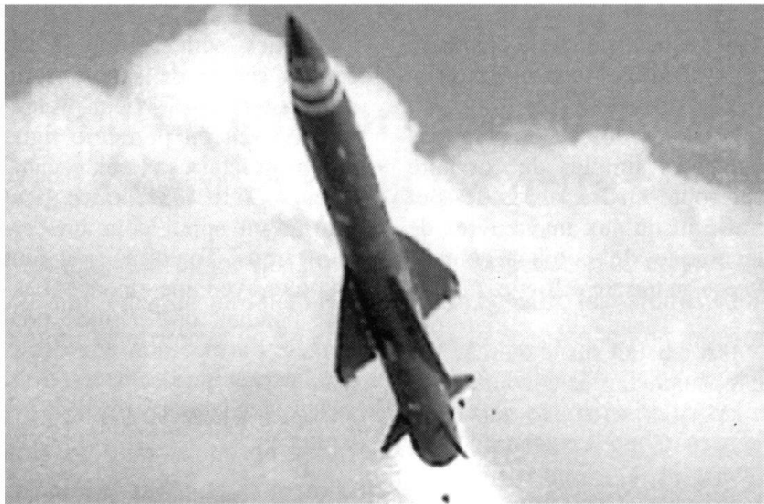
Missile Rapier Mark 2.

Divers chars de dépannage offrant des prestations similaires sont disponibles sur le marché. Ils sont tous construits sur la base du châssis d'un char de combat existant. L'évaluation de l'un de ces véhicules n'a cependant pas été entreprise, car il aurait été nécessaire de mettre en place une infrastructure logistique spécifique pour un nombre restreint de véhicules. Des essais techniques et logistiques ainsi que des essais à la troupe ont été réalisés en Suisse avec un char de dépannage de l'armée allemande. Ces essais ont confirmé les résultats positifs des essais allemands ainsi que les bonnes expériences réalisées depuis 1994 en Allemagne et en Hollande.