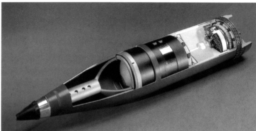
Modèle en coupe de la munition intelligente d'artillerie de 15,5 cm.

L'armée suisse dispose actuellement du Char de dépannage 65/68 , qui peut être utilisé pour le dépannage de véhicules chenillés jusqu'à 40 tonnes. Il ne suffit donc pas pour le Leopard qui pèse 57 tonnes. C'est la raison pour laquelle le Leopard est tracté au moyen