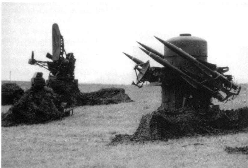
Systeme d'engins guidés mobiles de DCA Rapier .

Cette munition est dite intelligente parce que, durant la dernière phase de son vol, l'obus expulse deux éléments actifs (des submunitions) capables d'identifier et de combattre de manière autonome à partir du haut les objectifs à l'intérieur de la surface de recherche. La munition auto-chercheuse permet à l'artillerie de combattre