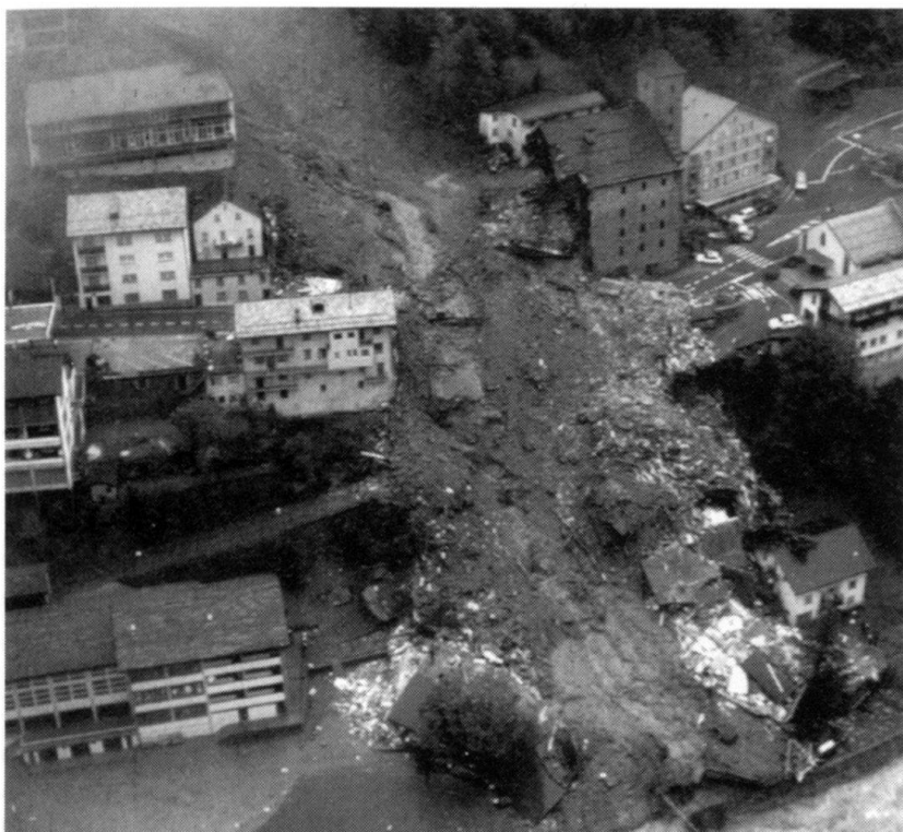
L'automne dernier, une coulée de boue ravageait le village de Gondo en Valais.

trouvait sur un vrai baril de poudre. «Nous travaillions sur le terrain industriel inondé d'Alusuisse. Les fours de la fonderie coulaient à jet continu. Je ne pouvais pas penser une seconde à ce qui se passerait si l'eau les atteignait. C'est pourquoi le mot d'ordre était: garder son calme, faire son travail à cent pour cent juste, en gardant la tête froide.» Cet engagement de catastrophe amena le caporal Walke à une intéressante constatation: «Je remarque que chacun a deux visages. Lorsque cela devient sérieux, les grandes gueules, pénibles durant 14 semaines, se sont faites toute petites. Et des timides se sont révélés comme leaders, ayant la vue d'ensemble et sachant souverainement ce qu'il fallait faire. Même ceux