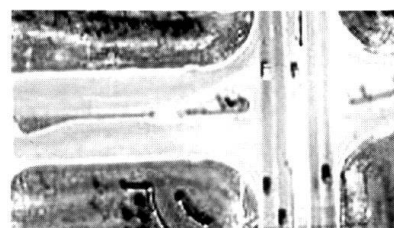
Vue du terrain par des satellites performants.

L'armée américaine a réduit de moitié ses divisions blindées mais a maintenu ses capa-