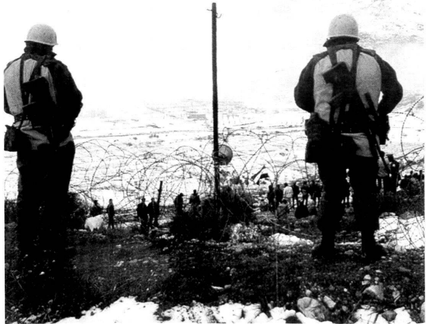
Des Casques bleus en opération de maintien de la paix en Bosnie.

Un second défi majeur pour les pays membres de l'UE sera