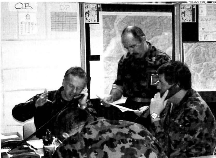
Etat-major en plein travail dans un PC «enterré».

Pourtant, puisque la coopération avec l'étranger devient un élément central de notre politique de sécurité, elle doit aussi le devenir dans le domaine de l'instruction et se traduire au mieux par le biais de projets concrets. Une collaboration ciblée s'impose donc avec les Etats partenaires qui disposent de simulateurs de commandement. Comme dans d'autres