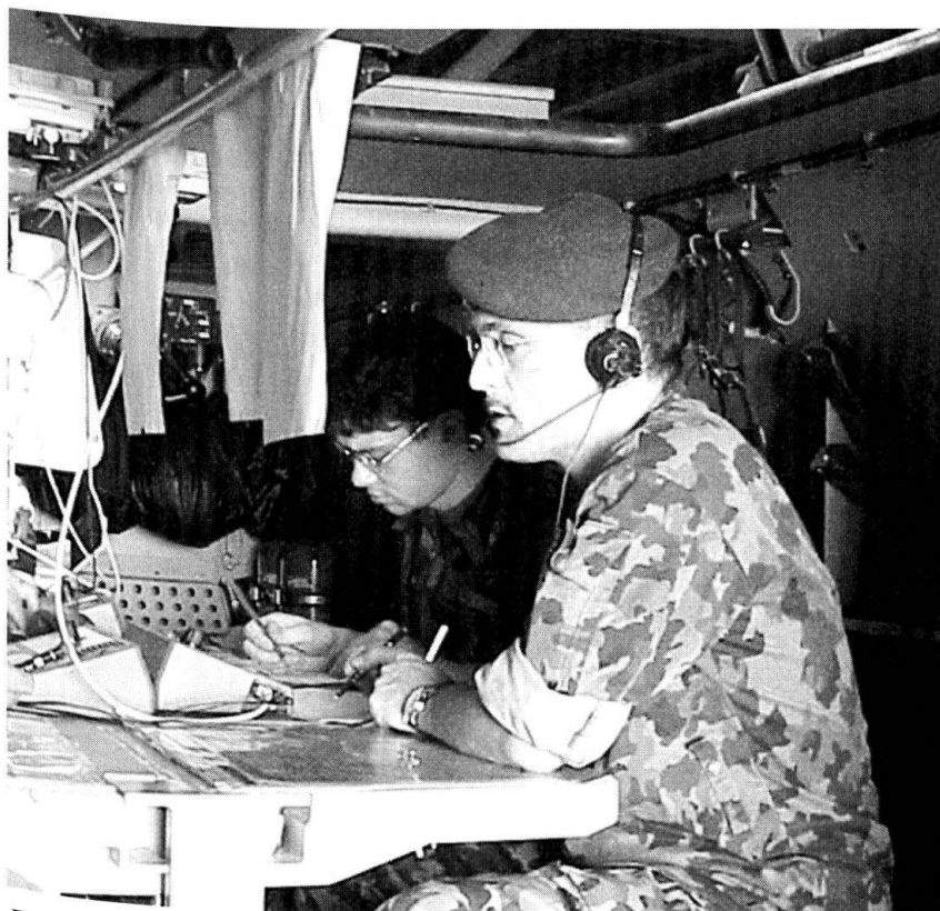
Equipe de commandement dans un char de commandement.