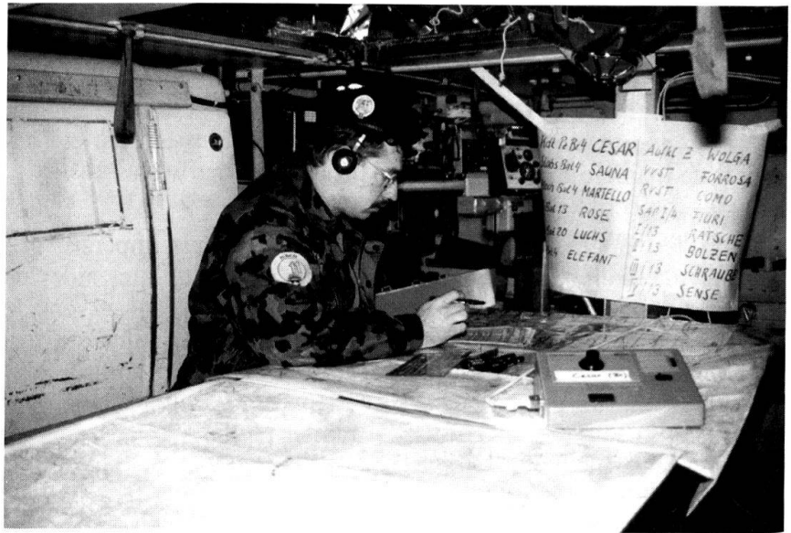
Prise de décision dans la solitude?

RMS: N'y a-t-il pas un problème avec les dispenses ac-