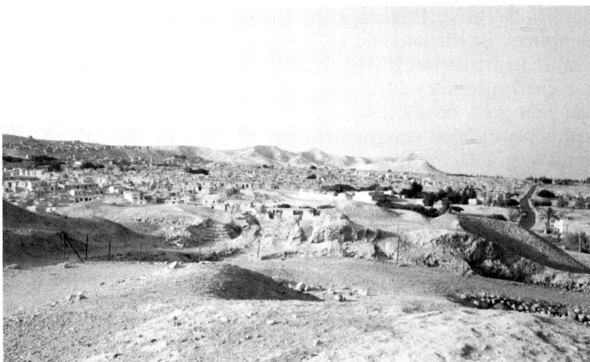
Camp de réfugiés palestiniens près de Jéricho. (Photo prise en 1984). Il faut de l'eau dans ce désert...

Israël, de son côté, affirme un droit d'antériorité sur l'exploitation de l'aquifère de Cisjordanie. Les colons juifs, à partir de 1930, ont commencé à exploiter ce réservoir d'eau. Ensuite, entre 1948 et 1965, Israël a creusé autour des monts de Judée et de Samarie de nombreux puits et installé des systèmes de drainage, le tout à l'intérieur des frontières israé-