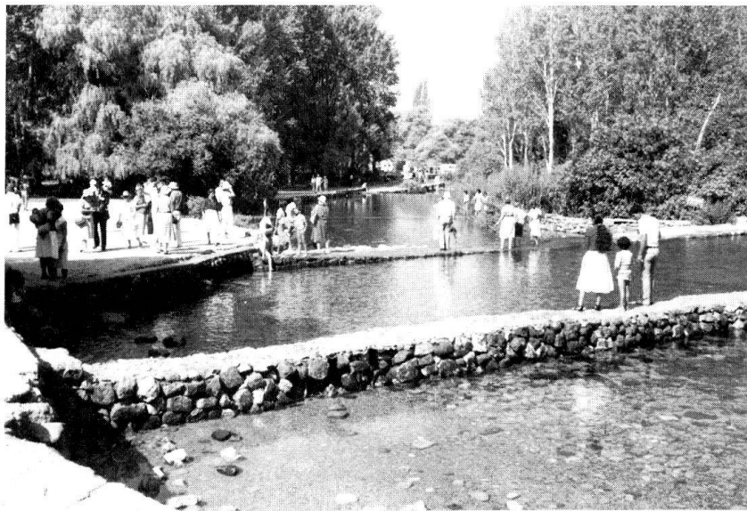
Vue des sources du Jourdain. (Photo prise en 1984).

Désormais, les seules revendications sionistes sur l'eau, qui restent insatisfaites, portent sur le Litani, toujours sous souveraineté libanaise. Déstabilisé par la question palestinienne et les divergences profondes qu'elle suscite à l'intérieur, le Liban plonge dans la guerre civile en avril 1975, après de multiples incidents entre phalangistes chrétiens et combattants palestiniens. Un an après, la Syrie intervient dans le conflit. Pour Damas, il s'agit d'empêcher les Palestiniens de prendre le contrôle du Liban et d'interrompre la montée en puissance des Sunnites. Pour Israël, la guerre civile libanaise est une aubaine qui pourrait permettre de s'emparer des réserves en eau du bassin du Litani, de recomposer le Liban, voire la Syrie, suivant un schéma communautaire et de créer