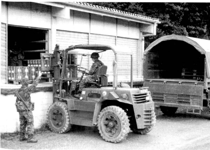
Les infrastructures logistiques peuvent, elles aussi, être « dégraissées »!

En dernier lieu, il s'agit d'évaluer et de s'assurer la possibilité industrielle de créer l'armement et les moyens logistiques spécifiques nécessités par la menace qui se présente, leur production, leur achat et l'assurance de leur approvisionnement.