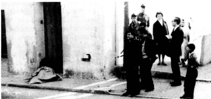
Une victime des terroristes gît devant une porte. Les attentats contre les pieds-noirs entraînent inévitablement des représailles.

Acteur déroutant, Aussaresses apparaît sur la scène algérienne. D'emblée, il provoque un sentiment de malaise. On parle aujourd'hui du «cas» Aussaresses. Qui est donc ce