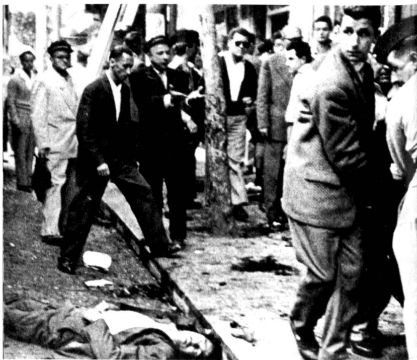
Le 3 juin 1957, à Alger, des bombes à retardement sont déposées dans des socles de lampadaires situés à des arrêts d'autobus. Elles explosent à l'heure de sortie des bureaux. Bilan: 10 morts, 86 blessés.

Les textes abondent sur le comportement des soldats français durant la «bataille d'Alger», soit ceux qui les traînent dans la boue, soit ceux qui les couvrent de fleurs. Les militaires ont rechigné à quitter le