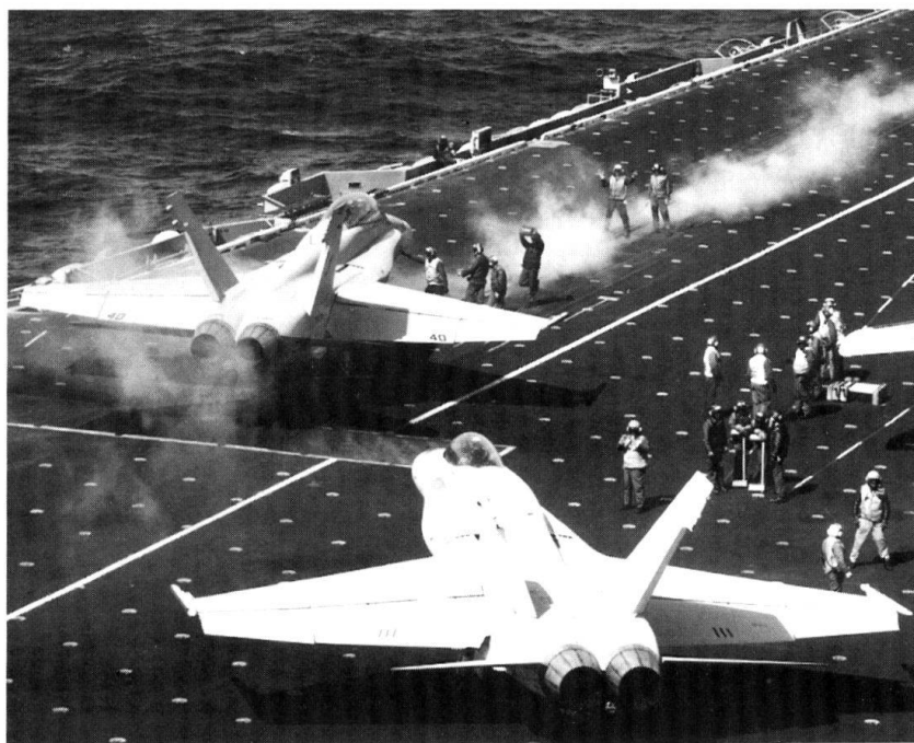
Des F/A-18 en action sur un porte-avions de l'US Navy.

La destruction des missiles Scud par des attaques aériennes s'avère également un semi-