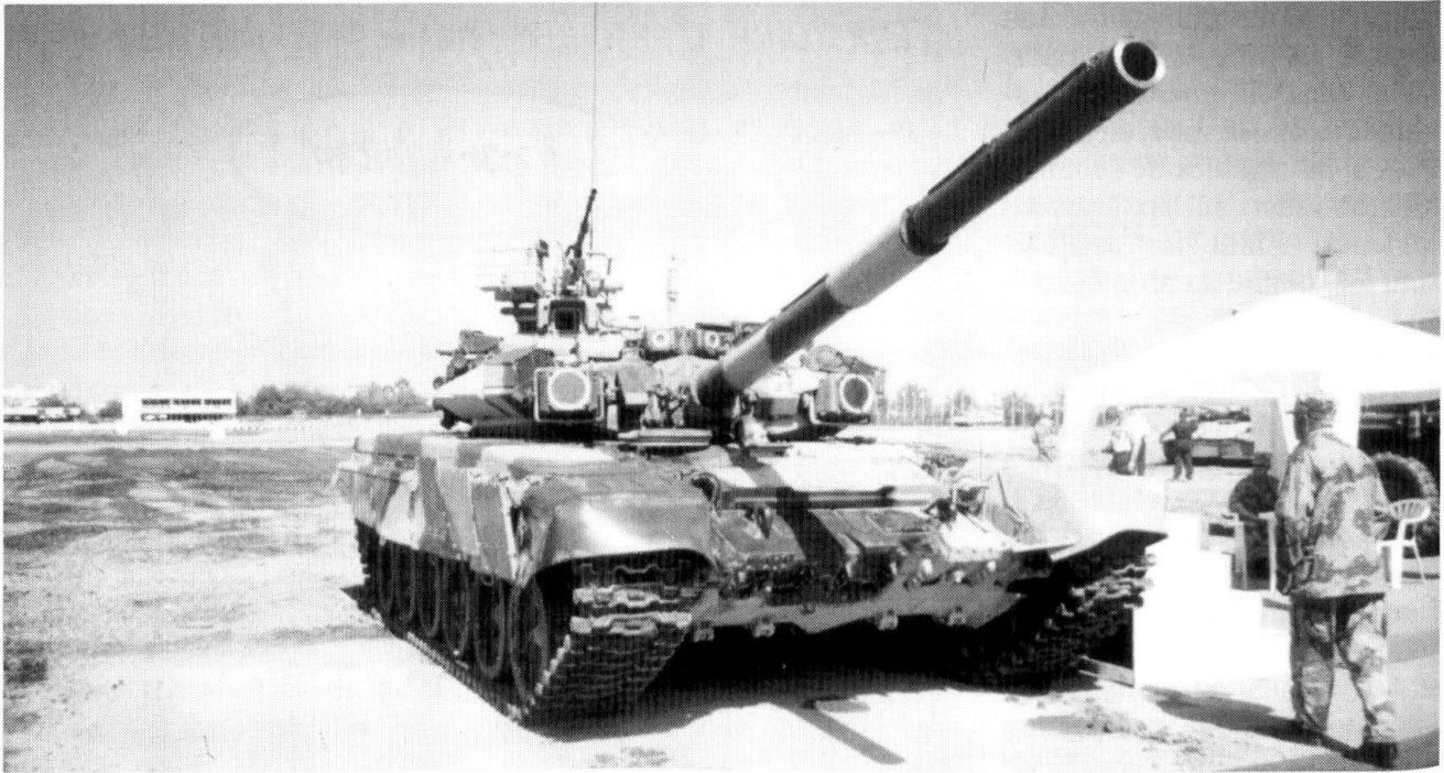
Le char de bataille russe T-90.