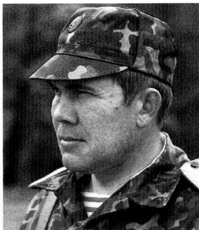
Le général Lebed, qui s'était lancé en politique, est mort récemment dans un accident d'hélicoptère.

Le général Alexandre Lebed, considéré comme un héros de la guerre d'Afghanistan, a signé les accords historiques de Khassaviourt ayant mis fin à la première guerre de Tchétchénie, dont il avait d'ailleurs dénoncé les exactions commises par les troupes russes. C'est aussi un ancien des troupes aéroportées. Il est devenu politicien et a décrit le processus avec amertume. «L'officier démobilisé se dit: 'J'ai servi pendant vingt ans, je me suis ruiné la santé et me suis sacrifié pour