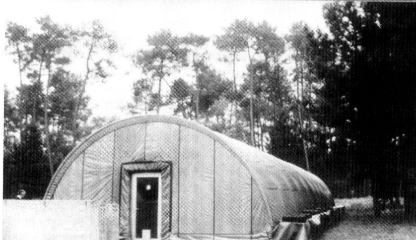
Grosse différence si la base dispose de «cavernes protégées» ou seulement d'abris légers!