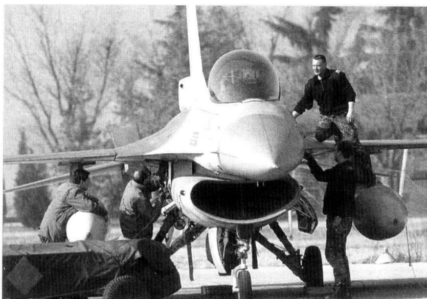
La protection d'une base aérienne a comme mission première d'assurer la continuité du service de vol.

Pour de nombreux pays, la sécurité d'une base aérienne et de ses installations est logique-