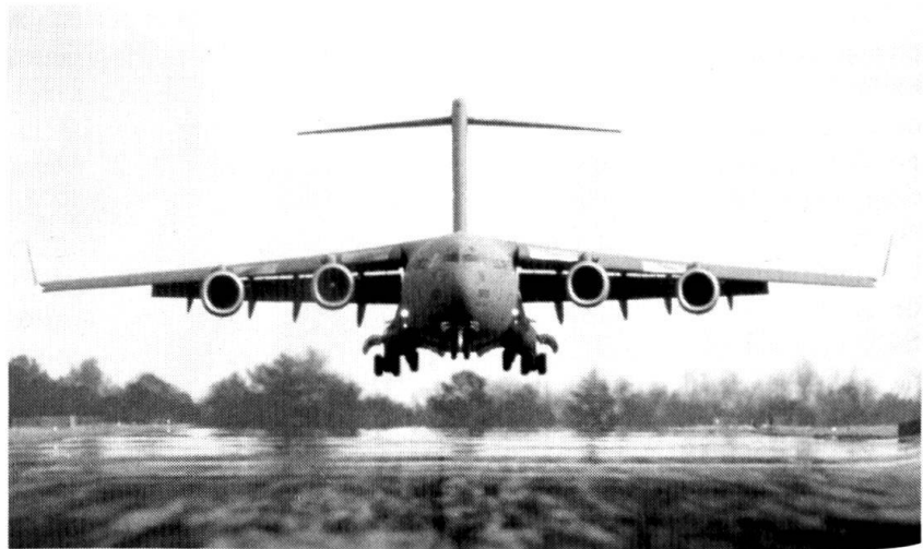
Qu'il s'agisse d'une base aérienne permanente ou de « campagne », les mesures de sécurité ne sont pas identiques et n'exigent pas les mêmes moyens en hommes...

Les OGRV sont également utilisés au niveau protocolaire comme gardes d'honneur, lors