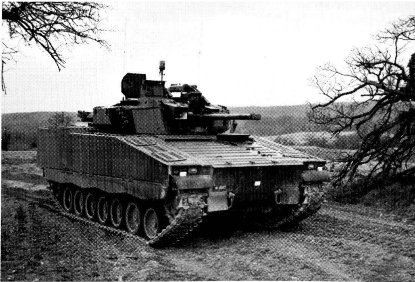
Le Char de grenadiers 2000.

placée par une Plate-forme d'armes autonomes (AWS) , montée et stabilisée sur le toit de la tourelle, et commandée depuis l'intérieur du char. Apte au combat de nuit, l'AWS sera équipée d'une mitrailleuse de 12,7 mm, actionnée en priorité par le chargeur, le cas échéant par le commandant du char. Les grands champs de pointage et d'action de cette plate-forme conféreront au Char 87 Leo une aptitude toute particulière pour mener le combat en zone urbaine.