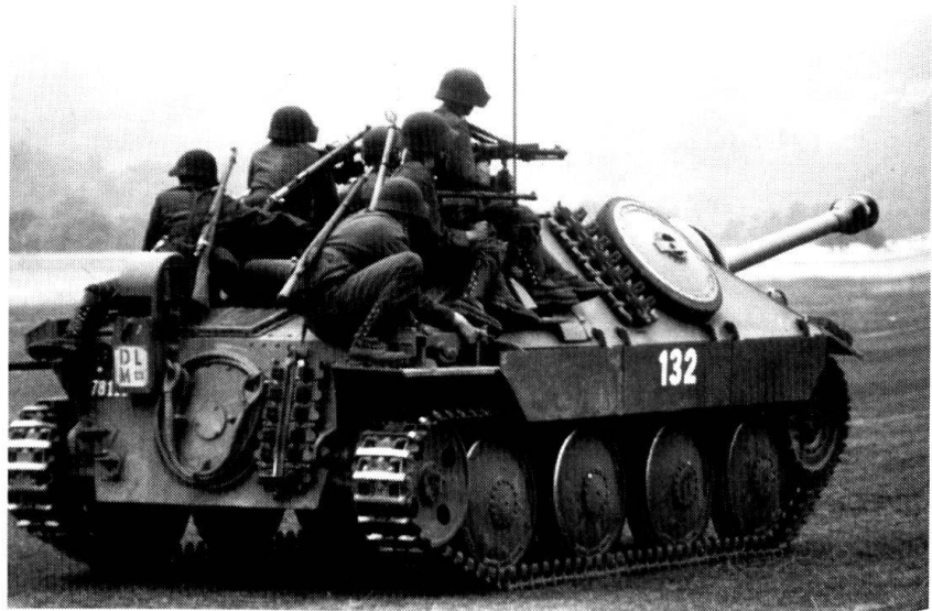
Un G-13 avec des « grenadiers ».

Les réformes militaires entreprises par de nombreux Etats européens entraînent une modi-