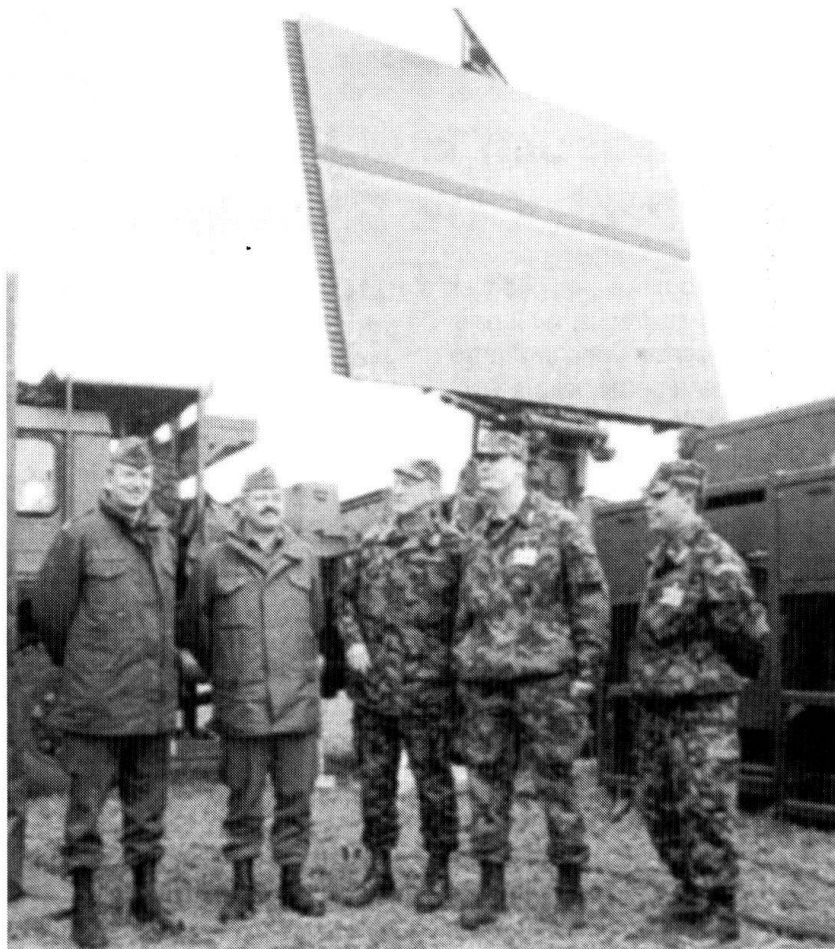
Des officiers autrichiens et suisses, lors de l'exercice AMADEUS 2002, en Autriche. Derrière eux, un Taflir.

nocturne constituait l'un des obstacles majeurs au développement des drones solaires destinés à voler durant des périodes prolongées en haute altitude: ce problème est en passe d'être résolu. Tirant parti des avancées technologiques dans le domaine des piles à combustible auto-régénératives, les ingénieurs d'AeroVironment, en collaboration avec la NASA, ont mis au point un Energy Storage System qui ouvre la voie au vol pendant de très longues périodes. L'excès de puissance électrique produit par les panneaux solaires durant le jour est utilisé pour produire de l'oxygène ainsi que de l'hydrogène par électrolyse de l'eau. Les gaz sont stockés sous pression et recombinaient la nuit pour procurer eau et électricité. Lors d'essais statiques, il a été possible d'obtenir une puissance électrique de 4,6 kW pendant cinq heures après production, puis stockage gazeux ayant consommé, de jour, 16 kW pendant 5 heures 30 minutes. L' Energy Storage System doit être prochainement monté sur le drone Helios aux fins d'expérimentations. A terme, le but est de maintenir l'engin en vol pendant plusieurs mois, afin de l'utiliser en tant que moyen de surveillance ou de relais pour tous types de réseaux d'information. (TTU Europe, 2 mai 2002).