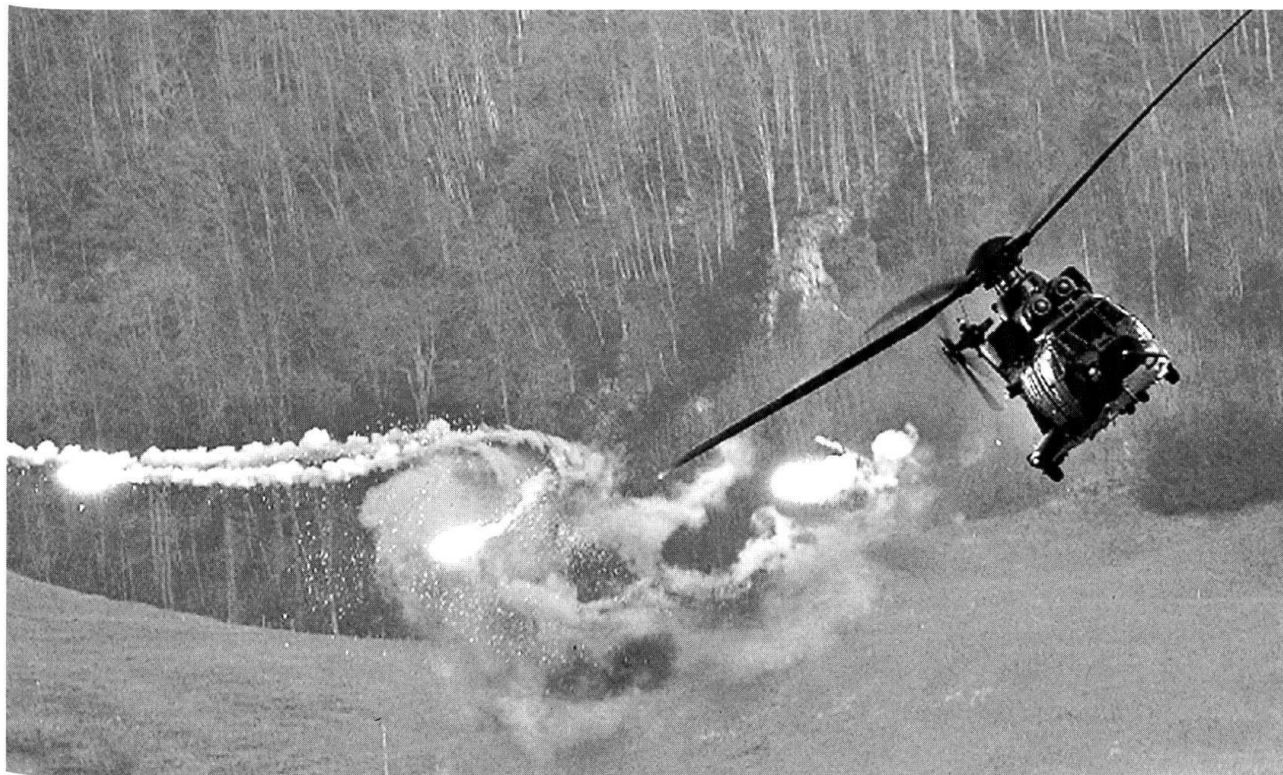
Ejection de Flares par un hélicoptère de transport TH 98.