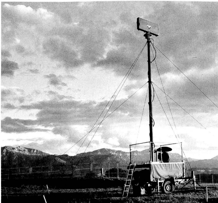
Système d'alerte Stinger monté sur mât.

Cette famille d'appareils radio est un système de conduite radio tactique composé d'éléments modulaires. Il permet la transmission digitale de données et de la parole dans une bande de fréquences comprise entre 30 et 80 MHz. La protection cryptologique intégrée ainsi que le fonctionnement par sauts de fréquences remplit les exigences posées à un système radio tactique sur le champ de bataille moderne. Ces appareils garantissent une résistance élevée contre l'exploration électronique adverse ainsi que contre le brouillage. La planification de fréquences, des clés et du réseau est réalisée au moyen d'une unité assistée par ordinateur. La deuxième tranche d'acquisition permet de remplacer l'intégralité des an-