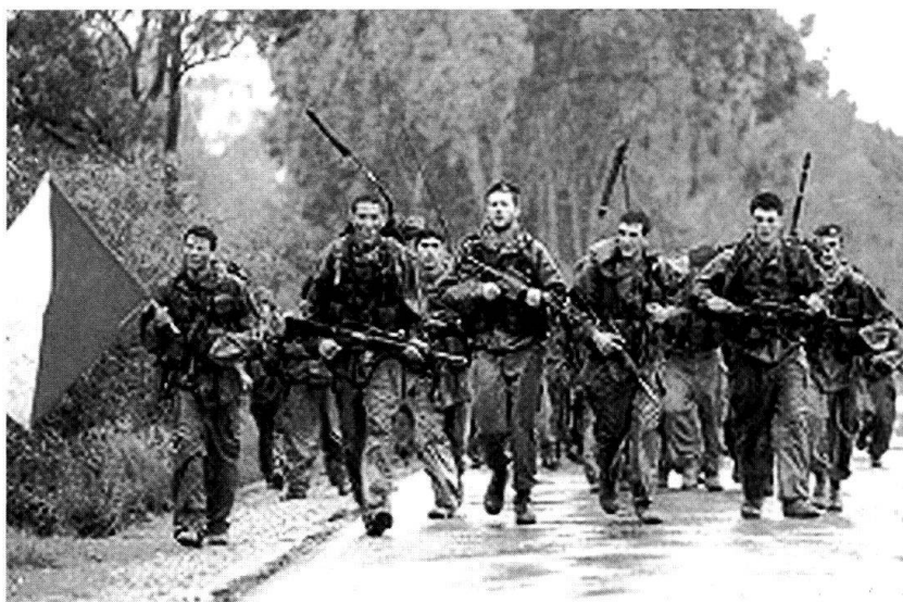
De jeunes Israéliens à l'instruction.

Les forces aériennes sont le moyen offensif mobile par excellence assurant la souveraineté de l'espace aérien; elles sont aidées par la défense anti-aérienne avec des armes à longue portée et des systèmes anti-missiles. La marine a pour mission de garder les côtes, de protéger l'espace sous-marin et de faire des reconnaissances de l'espace aérien.